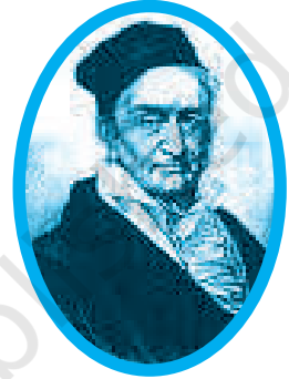
कार्ल फ्रैड्रिक गॉस (1777 – 1855)

अंकगणित की आधारभूत प्रमेय के रूप में विख्यात होने से पहले, प्रमेय 1.2 का संभवतया सर्वप्रथम वर्णन यूक्लिड के एलीमेंट्स की पुस्तक IX में साध्य (proposition) 14 के रूप में हुआ था। परंतु इसकी सबसे पहले सही उपपत्ति कार्ल फ्रैड्रिक गॉस (Carl Friedrich Gauss) ने अपनी कृति डिसक्विशंस अरिथिमेटिकी (Disquisitiones Arithmeticae) में दी। कार्ल फ्रैड्रिक गॉस को प्रायः 'गणितज्ञों का राजकुमार' कहा जाता है तथा उनका नाम सभी समयकालों के तीन महानतम गणितज्ञों में लिया जाता है, जिनमें आर्किमिडीज़ (Archimedes) और न्यूटन (Newton) भी सम्मिलित हैं। उनका गणित और विज्ञान दोनों में मौलिक योगदान है।