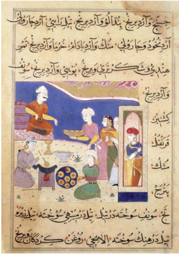
निमतनामा, मांडू, 1550, ब्रिटिश लाइब्रेरी, लंदन

फ़ारसी, तुर्क और अफ़ग़ान के प्रभाव को चित्रों में देखा जा सकता है। विशेष रूप से उन क्षेत्रों में, जहाँ सुल्तानों द्वारा चित्रों का निर्माण करवाया गया, जैसे कि मालवा, गुजरात, जौनपुर और अन्य सल्तनत शासित क्षेत्र। इन राजदरबारों में कुछ मध्य एशियाई कलाकारों के साथ स्थानीय कलाकारों द्वारा चित्रों के निर्माण से, स्वदेशी शैलियों और फ़ारसी शैलियों के परस्पर मिश्रण से एक नई शैली का उदय हुआ, जिसे सल्तनत चित्रकला के रूप में जाना जाता है।