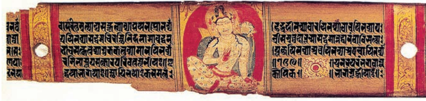
लोकेश्वर, अष्टसहस्रिका प्रज्ञापारामिता, पाल, 1050, राष्ट्रीय संग्रहालय, नई दिल्ली

महाविहार (विश्वविद्यालयों) में आए और पालकालीन बौद्ध कला के कांस्य और सचित्र पांडुलिपियों के नमूने अपने साथ वापस ले गए। इस प्रथा ने पाल कला का विभिन्न स्थानों उदाहरणस्वरूप नेपाल, तिब्बत, बर्मा, श्रीलंका और जावा देशों में सुगमता से प्रसार किया।