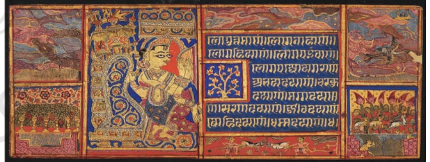
इंद्र द्वारा देवसानो पाड़ो की स्तुति कल्पसूत्र, गुजरात, लगभग 1475, संग्रह, बोस्टन

जैन चित्रकला में विशेष प्रकार के संयोजन (योजनाबद्ध) और सरलीकृत भाषा का विकास हुआ। अधिकांश चित्रों में विभिन्न घटनाओं को समायोजित करने के लिए चित्र पटल को वर्गों में विभाजित किया गया। चित्रों में चमकीले रंग और कपड़े के अलंकरण का प्रभाव स्पष्ट रूप से देखा जा सकता है। संयोजन में पतली, लहरदार रेखाओं का प्रबल प्रभाव है और चेहरे को तीन-आयामों में दर्शाने के लिए एक अतिरिक्त आँख का उपयोग देखने को मिलता है। चित्रों में वास्तुशिल्प में सल्लनत कालीन गुंबद और नुकीले मेहराब का चित्रण, गुजरात, मांडू, जौनपुर और पाटन के क्षेत्रों में सुल्तानों की राजनीतिक उपस्थिति को दर्शाते हैं, जहाँ ये चित्र बने। कपड़े के चंदवा या शामियानों और पर्दों, मेज़, कुर्सी आदि वेशभूषा, उपयोगी वस्तुओं इत्यादि पर स्वदेशी और स्थानीय जीवन शैली का प्रभाव स्पष्ट रूप से दिखता है। भू-दृश्य या प्रकृति-दृश्य के स्वरूपों का चित्रण विस्तृत रूप में न होकर मात्र सांकेतिक या साधारणतः किया गया है। लगभग 1350–1450 के सौ वर्षों की अवधि को जैन चित्रकला का सबसे रचनात्मक काल माना जाता है। चित्रों की संरचना में एक महत्वपूर्ण परिवर्तन का अनुभव किया जा सकता है, जहाँ प्रबल रूप से देवी-देवताओं के साथ आकर्षक रूप से चित्रित, भू-दृश्य या प्रकृति-दृश्य, नृत्य करती मानव आकृतियाँ और वाद्ययंत्र बजाते संगीतकारों का चित्रण मुख्य चित्र के हाशिये पर किया गया है।