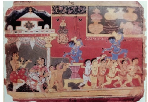
मीठाराम, भागवत पुराण, 1550

उत्तर, पूर्व और पश्चिम के कई क्षेत्रों पर बारहवीं शताब्दी के अंत में मध्य एशिया के सल्तनत राजवंशों के शासन में आने के बाद, स्पष्टतः