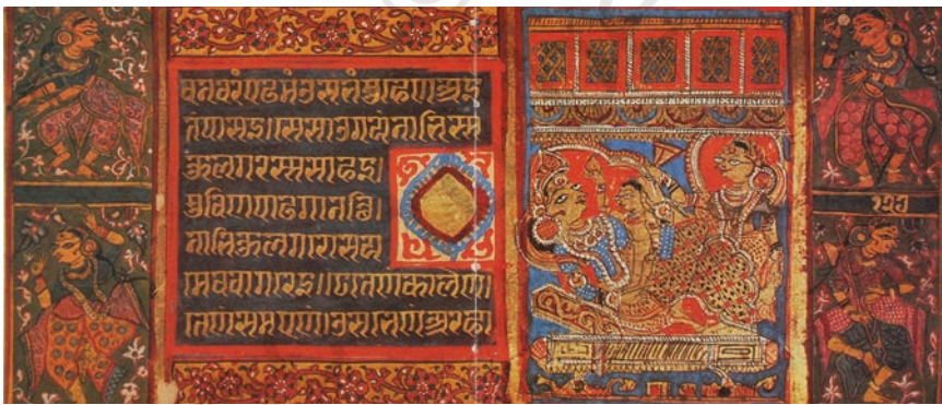
महावीर का जन्म, कल्पसूत्र, पंद्रहवीं शताब्दी, जैन भंडार, राजस्थान

शास्त्र दान की परंपरा के कारण जैन शैली के विकास को और प्रोत्साहन मिला। जैन समुदाय में, सचित्र पांडुलिपि को मठ के पुस्तकालय, जिसे भंडार कहा जाता था, में दान करना एक परोपकार, सदाचार व धार्मिक कृत्य माना जाता था।