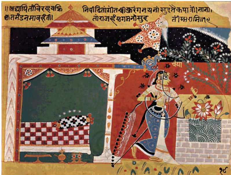
चौरपंचाशिका, गुजरात, पंद्रहवीं शताब्दी, एन. सी. मेहता संग्रह, अहमदाबाद, गुजरात

इसी समय में, हिंदू और जैन विषयों के अनेक चित्रों को चित्रित किया गया, जैसे— महापुराण, चौरपंचाशिका, महाभारत का अरण्यक पर्व, भागवत पुराण, गीत गोविंद और अन्य कुछ चित्रांकन, जो इस स्वदेशी शैली का प्रतिनिधित्व करते हैं। इस काल और शैली को साधारण रूप से पूर्व-मुगल या पूर्व-राजस्थानी शैली के रूप में भी जाना जाता है, जिसे स्वदेशी शैली भी कहा जा सकता है।