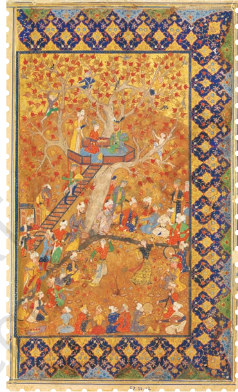
चित्र क— अमीर खुसरो डीहलवी के खमसा से, 16वीं शताब्दी

कर एक नए वाद्य यंत्र का निर्माण किया, जो अपने तारों की संख्या के कारण 'सहतार' और फिर परिवर्तित हो कर 'सितार' के नाम से प्रसिद्ध हुआ। अमीर खुसरो ने गायन की एक नवीन शैली को भी जन्म दिया, जो 'कव्वाली' कहलाती है। राग-वर्गीकरण का एक नवीन प्रकार के राग गृहीत स्वरों से निकाल उन्होंने रागों के गाने योग्य तद्देशीय भाषा में नए-नए गीतों की रचना की। यही गीत आगे चलकर 'ख्याल' के नाम से प्रसिद्ध हुए अतः ख्याल के जन्मदाता के रूप में भी अमीर खुसरो को मान्यता दी जाती है। ऐसा कहा जा सकता है कि अमीर खुसरो ने संगीत के क्षेत्र में अविस्मरणीय कार्य किया है। इनका देहावसान लगभग 72 वर्ष की आयु में हुआ।