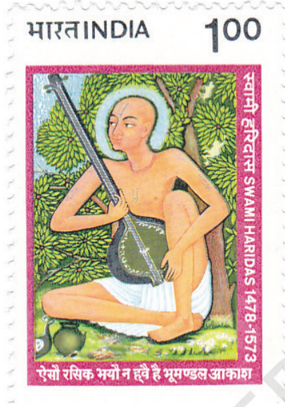
चित्र ग— भारत सरकार द्वारा स्वामी हरिदास का जारी किया गया टिकट