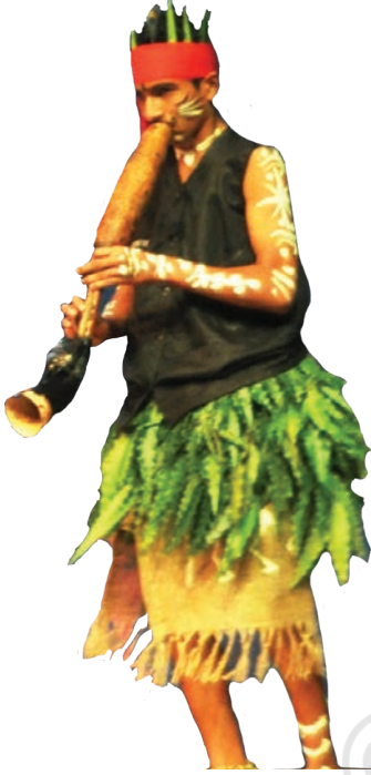
लोक वाद्य— तरपा कला उत्सव 2015