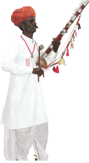
पारंपरिक वाद्य-रावणहत्था सीआईईटी, रा.शै.अ.प्र.प.