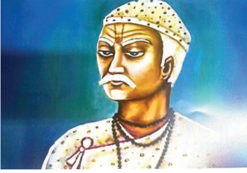
चित्र च— बैजनाथ मिश्र 'बैजू बावरा'

बैजू यानि बैजनाथ मिश्र का जन्म गुजरात के एक ब्राह्मण परिवार में हुआ था। यह 16वीं शताब्दी में मियाँ तानसेन के समकालीन ध्रुपद गायक थे। बाल्यकाल में ही उनके पिता का देहांत हो गया था, अतः उनके पालन-पोषण का भार उनकी माता पर आ गया। बैजू की माता श्रीकृष्ण की उपासिका थी। उनके प्रभाव से बैजू भी अपनी बाल्यावस्था में ही श्रीकृष्ण के अनन्य भक्त हो गए थे।