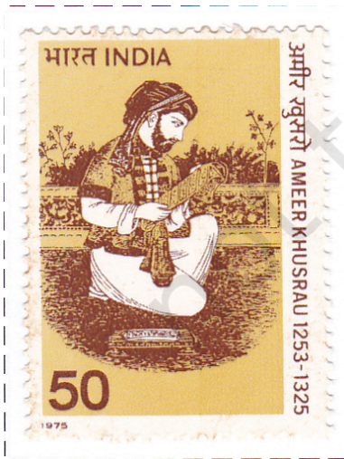
चित्र ख— भारत सरकार द्वारा अमीर खुसरो का जारी किया गया टिकट

मुसलमानी शासकों में अलाउद्दीन खिलजी पहला व्यक्ति था, जिसने संगीत की ओर रुचि प्रदर्शित की थी। उसके दरबार में अमीर खुसरो नामक एक विख्यात विद्वान थे। वह कई भाषाओं के ज्ञाता, फारसी के महान कवि और संगीत कला के मर्मज्ञ थे। उन्होंने भारतीय संगीत में अरबी, ईरानी, तूरानी तत्वों का समावेश कर मिश्रित राग और नवीन वाद्य यंत्रों का आविष्कार किया था। भारत और ईरानी संगीत को मिला कर उन्होंने जिन नए रागों का प्रचलन किया, उनमें साजगिरी, उश्शाक, ज़िला सरपरदा उल्लेखनीय हैं। उन्होंने भारत की परंपरागत वीणा के रूप में परिवर्तन