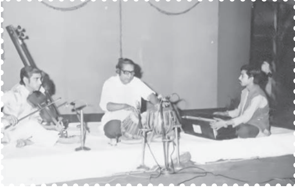
चित्र घ— सामता प्रसाद मिश्र उर्फ गुदई महाराज