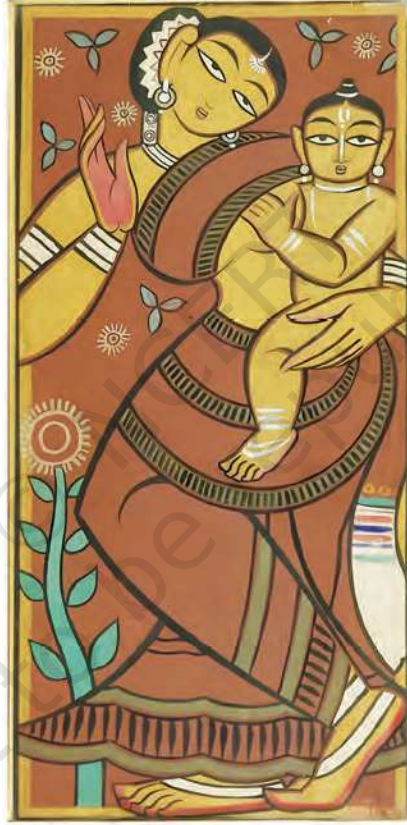
ماں اور بچہ، جیمینی رائے، کینوس پر روغن

6. مراہب کی بصری تخلیق میں درجہ بندی اہمیت کی حامل ہے۔ اس بات کا مشاہدہ کیجیے کہ اس مصوری میں سب سے زیادہ جگہ ماں کو دی گئی ہے۔ اس کے بعد توجہ بچے پر جاتی ہے اور پھر ارد گرد کی تفصیلات پر۔