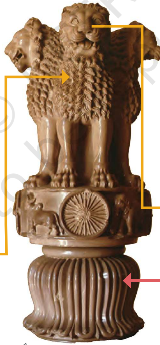
لائن کیپٹل، موریہ دور، تقریباً 250 قبل مسیح

4. بناوٹ بصری اور مادی ہو سکتی ہے۔ اسے چھو کر نرم، کھردری، دانے دار، ریشمی، خاردار یا کچھ اور محسوس کیا جاسکتا ہے۔ اسے لکیروں اور نقطوں کے پیٹرن سے بھی دیکھا جاسکتا ہے۔