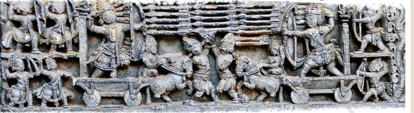
चित्र 2.2— 12वीं सदी की महाभारत, हलेबिदु, कर्नाटक

परिवर्तित करने हेतु 'हारु', 'हाई', 'अथ', 'इह', 'ई' आदि स्तोभाक्षरों का प्रयोग करते हुए स्वर में गाया जाता था। साम गान को ईश्वरोपासना का एक प्रमुख साधन माना जाता था।