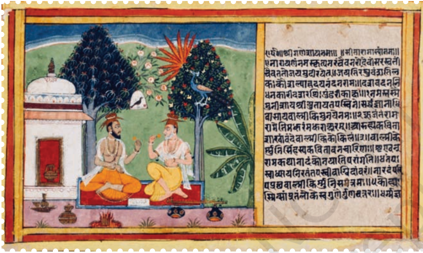
चित्र 2.1— रामायण पांडुलिपि, मेवाड़ी चित्र, राजस्थान, 1653 ई.

संगीत' के नाम से जाना गया। अश्वमेध यज्ञ के अवसर पर यज्ञकर्म के लिए एकत्रित ऋत्विजों में उद्गाता (साम गान करने वाले मुख्य गायक) को सम्मानित स्थान प्राप्त था। श्रीरामचन्द्र के आदेश पालन पर लव-कुश ने मार्गी शैली से गांधर्व का गान किया था तथा स्वर, पद, ताल, प्रमाण एवं मूर्च्छना आदि अंगों से गान कर श्रोताओं को मंत्रमुग्ध किया था। उस काल में गांधर्व का प्रदर्शन श्रोताजनों की योग्यता के अनुकूल किया जाता था।