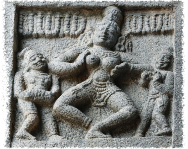
चित्र 2.3— चिदंबरम नटराज मंदिर पूर्वी गोपुरा में 13वीं शताब्दी के नाट्यशास्त्र नृत्य की मुद्रा

इस ग्रंथ के रचयिता महर्षि भरत मुनि हैं तथा इसका रचना काल ईसा पूर्व दूसरी शताब्दी से ईसा पश्चात् दूसरी शताब्दी तक माना जाता है। प्राचीन काल में भरत शब्द (संगीत कुशल) नट के अर्थ में प्रयुक्त होता था। विद्वानों के मतानुसार नाट्यशास्त्र एक संग्रह ग्रंथ है। इसके लेखक आदि भरत आचार्य थे, परन्तु उनके अतिरिक्त उनके शिष्यों द्वारा भी सूत्रों का संग्रह किया गया और इस ग्रंथ को आगे बढ़ाया गया। इसी कारण उनके शिष्य भी