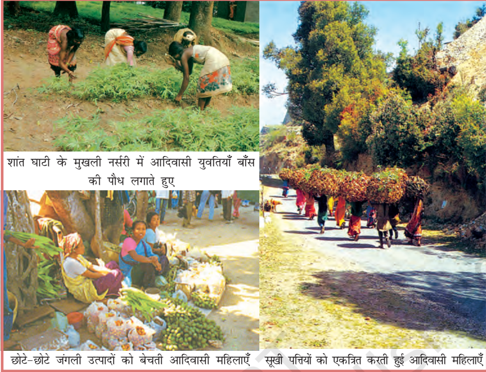
शांत घाटी के मुखली नर्सरी में आदिवासी युवतियाँ बाँस की पौध लगाते हुए