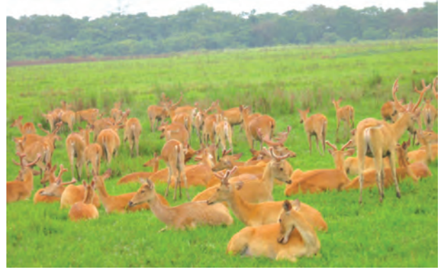
चित्र 2.2 – कांजीरंगा राष्ट्रीय उद्यान में गैंडा और हिरन

इसका उद्देश्य बहुत बड़े आकार के जैवजाति को भी बचाना है। उत्तराखण्ड में कॉरबेट राष्ट्रीय उद्यान, पश्चिम बंगाल में सुंदरबन राष्ट्रीय उद्यान, मध्य प्रदेश में बांधवगढ़ राष्ट्रीय उद्यान, राजस्थान में सरिस्का वन्य जीव पशुविहार (sanctuary), असम में मानस बाघ रिज़र्व (reserve) और केरल में पेरियार बाघ रिज़र्व (reserve) भारत में बाघ संरक्षण परियोजनाओं के उदाहरण हैं।