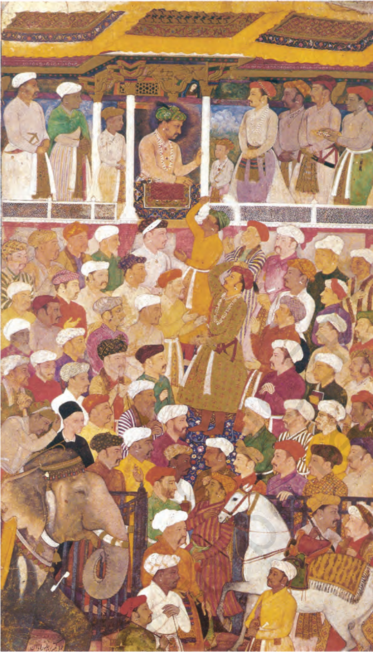
दरबार में जहाँगीर, जहाँगीरनामा, अबुल हसन और मनोहर, 1620, ललित कला संग्रहालय, बोस्टन