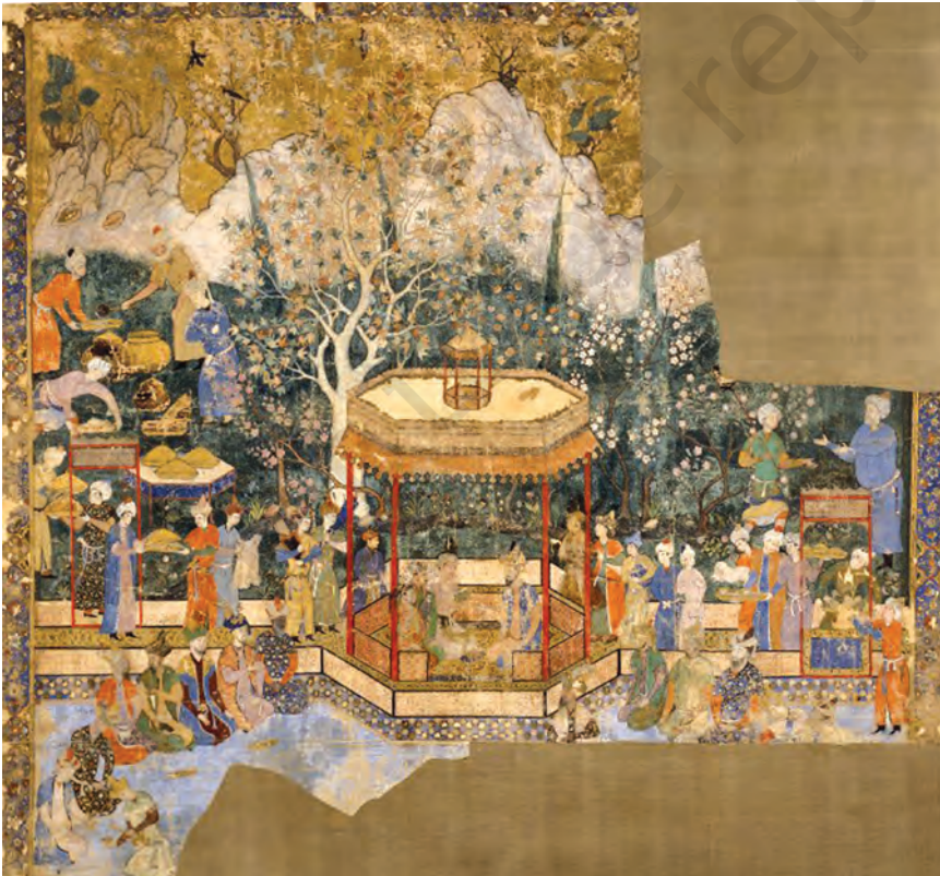
तैमूर के दरबार के राजकुमार, अब्द उस समद, 1545-50 ब्रिटिश संग्रहालय, लंदन

प्रथम मुगल शासक बाबर वर्तमान के उज्बेकिस्तान से 1526 में भारत आया। वह तैमूर और चरघटाई तुर्क का वंशज था। उसने ईरान व मध्य एशिया की संस्कृति और सौंदर्यात्मक संवेदनशीलता का सम्मिश्रण किया था। विभिन्न कलारूपों में बाबर की सक्रिय रुचि थी। उसकी ख्याति एक विद्वान और कला पारखी, पांडुलिपियों व वास्तुकला के उदार संरक्षक आदि के तौर पर थी। उसकी आत्मकथा बाबरनामा में सम्राट की राजनैतिक गतिविधियों व कलात्मक जुनून का विस्तृत विवरण है। बाबरनामा उस प्रेम व आसक्ति को दिखाता है जो एक विदेशी के तौर पर भारत के लिए बाबर के मन में थी। सभी घटनाओं को उत्साहवश विस्तार से लिखने के कारण बाबर ने संस्मरणों को दर्ज करने की परंपरा स्थापित की जिसका भारत में उसके उत्तराधिकारियों ने भी अनुकरण किया। शाही चित्रशाला में रचित पुस्तकें व एल्बम सिर्फ सुलिखित ही नहीं, बल्कि चित्रित भी की गईं। ये बहुमूल्य पुस्तकें संग्रहित की गईं और शाही परिवार के उन सदस्यों को भेंट की गईं जो उसके योग्य थे और उनका महत्व समझते थे। छवि चित्रण में बाबर की गहरी रुचि का जिक्र उसके संस्मरणों में मिलता है। उसके संस्मरण में चित्रकारों के उल्लेख के बीच बिहज़ाद का जिक्र आता है। बिहज़ाद के चित्र सुंदर होते थे पर वह चेहरों का उत्तम चित्रण नहीं