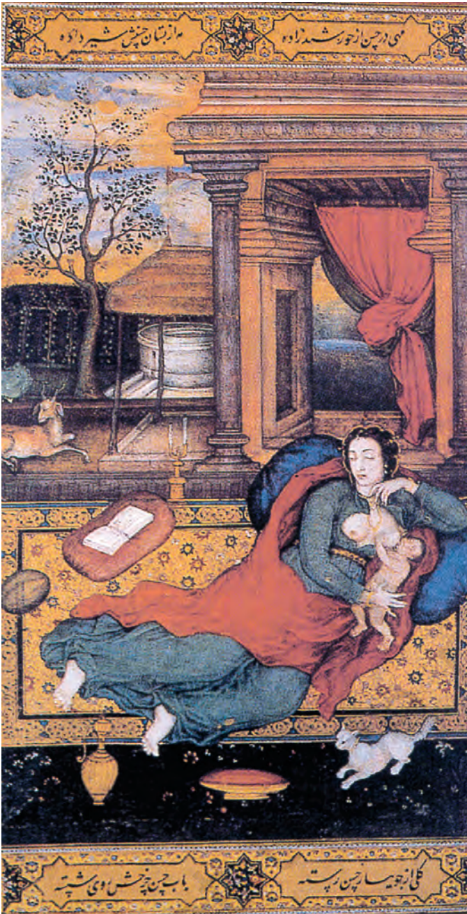
मेडोना एंड चाइल्ड, बसावन, 1590, सैन डिएगो कला संग्रहालय, कैलिफोर्निया

शहजादे सलीम (जहाँगीर) ने बहुत कम उम्र से कला में रुचि लेनी शुरू कर दी। अपने पिता अकबर के विपरीत (जिन्होंने राजनैतिक व धार्मिक महत्व के ग्रंथों पर चित्र और पांडुलिपियाँ बनाने का काम किया) जहाँगीर जिज्ञासु स्वभाव का था और उसने चित्रकारों को गहन निरीक्षण व उत्कृष्ट विवरणों के चित्रण के लिए प्रेरित किया।