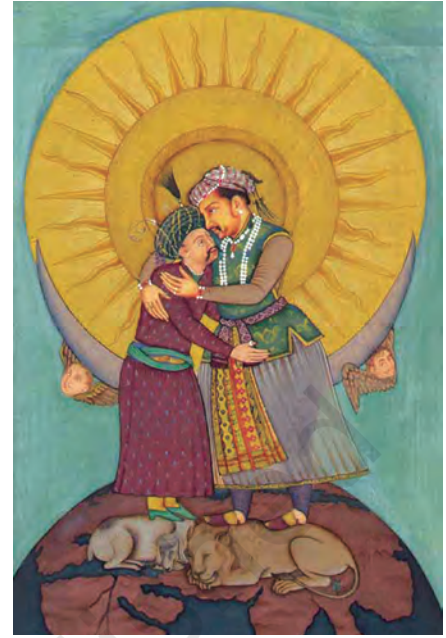
जहाँगीर का सपना, अबुल हसन, 1618–22, स्मिथसोनियन इंस्टीट्यूशन, वाशिंगटन डी.सी.

पदशाहनामा (राजा का इतिहास) दरबार की चित्रशाला के अंतर्गत चित्रित सबसे अधिक समृद्ध लुभावनी योजनाओं में से एक था। यह एक असाधारण पांडुलिपि है, जिसने भारतीय लघु चित्रकारी में ऊँचाइयों को पाया है। इस काल में मुगल चित्रकला ने शाही, ऐतिहासिक और रहस्यवादी विषयों को चित्रित करने के लिए सम्मोहक रंगों और जटिल संयोजनों का विभिन्न दृश्यों में प्रभावशाली प्रयोग किया।