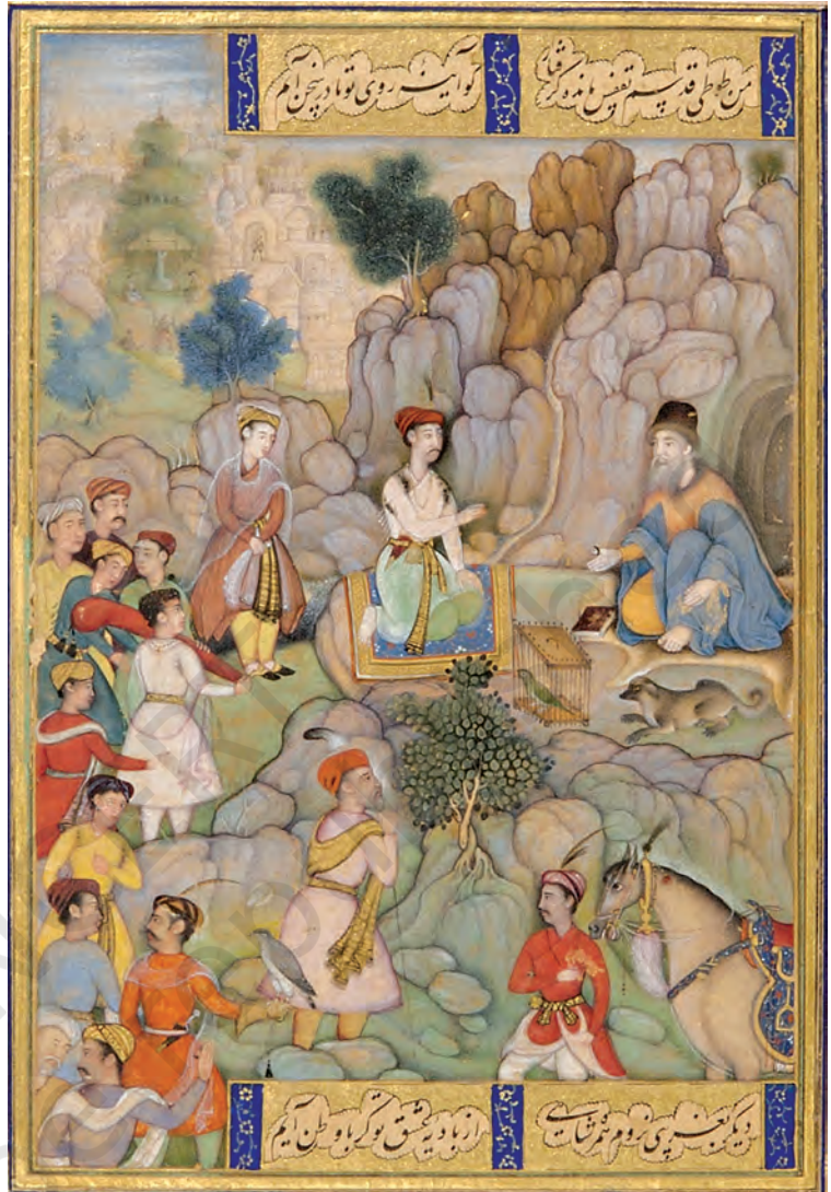
एक राजकुमार और एक साधु, अमीर शाही के दीवान से जिल्द के पन्ने, 1595, आगा खान संग्रहालय, कनाडा

अबुल हसन और मनोहर द्वारा 1620 में चित्रित जहाँगीरनामा (कई संग्रहों में बिखरा हुआ) का चित्र 'दरबार में जहाँगीर' एक विलक्षण चित्र है। चित्र के केंद्र में सबसे ऊँचे स्थान पर जहाँगीर हैं और उसकी आँखें चमकदार स्पष्ट रंगों से घिरे शानदार सफ़ेद स्तंभों और सिर के ऊपर की शानदार छतरी की ओर जाती हैं। दायीं ओर हाथ जोड़े खुर्रम उपस्थिति में खड़ा है और शुजा भी उसके बराबर में है। शुजा, मुमताज महल का पुत्र है जिसकी परवरिश दरबार में नूरजहाँ ने की है। दरबारियों को