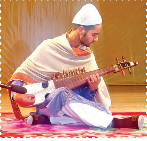
चित्र 4.2— शास्त्रीय वादन प्रस्तुति—रबाब

ख्याल में एक बंदिश या रचना होती है। इसमें शब्द अधिकांशतः हिंदी, उर्दू या ब्रजभाषा में होते हैं। यह विभिन्न राग एवं तालों में गाई-बजाई जाती है। अधिकतर तीनताल, झपताल, एकताल, झूमरा, रूपक में ख्याल की बंदिशें गाई जाती हैं जो प्रायः विलंबित, मध्य एवं द्रुत लय में प्रस्तुत की जाती हैं।