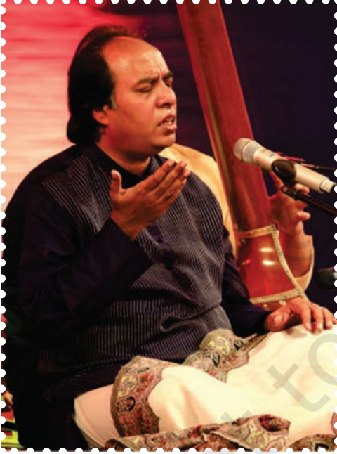
चित्र 4.1— उस्ताद वासिफुद्दीन डागर – ध्रुपद कलाकार