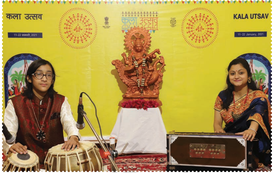
चित्र 4.3— शास्त्रीय वादन प्रस्तुति

2. रजाखानी गत — इस गत के निर्माता राजा खाँ है अतः उन्हीं के नामानुसार इसे 'रजाखानी गत' कहते हैं। यह तीन ताल में निबद्ध होती है जिसमें दा दिर दिर दिर दाऽ र, द डर, दा अथवा दिर दिर दाऽ र, दा डर, दा के निश्चित बोल होना अनिवार्य है। इसकी लय द्रुत होती है। बंदिश प्रस्तुत करने के पश्चात इसमें दुगुन में तानें तथा लड़ियाँ प्रस्तुत की जाती हैं। अंत में एक साथ इस गत का समापन किया जाता है। जिस गत में इन बोलों का पालन नहीं होता है उसे द्रुत गत कहा जाता है।