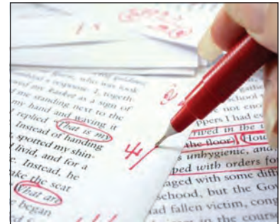
Proof reading in progress

Observe, how punctuation changes the meaning in the sentences given below.