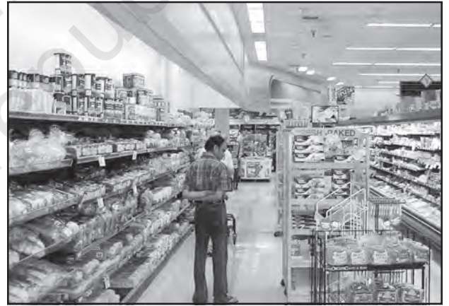
चित्र 6.3 : अमेरिका में डिब्बाबंद आहार बाजार

नगरीय बाजार केंद्रों में और अधिक विशिष्टीकृत नगरीय सेवाएँ मिलती हैं। इनमें न केवल साधारण वस्तुएँ और सेवाएँ बल्कि लोगों द्वारा वांछित अनेक विशिष्ट वस्तुएँ व सेवाएँ भी उपलब्ध होती हैं। नगरीय केंद्र, इसलिए विनिर्मित पदार्थों के साथ-साथ विशिष्टीकृत बाजार भी प्रस्तुत करते हैं जैसे श्रम बाजार, आवासन, अर्ध-निर्मित एवं निर्मित उत्पादों का बाजार। इनमें शैक्षिक संस्थाओं और व्यावसायिकों की सेवाएँ जैसे— अध्यापक, वकील, परामर्शदाता, चिकित्सक, दाँतों का डॉक्टर और पशु चिकित्सक आदि उपलब्ध होते हैं।