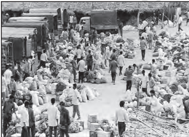
चित्र 6.2 : सब्जियों का थोक बाजार

ग्रामीण विपणन केंद्र निकटवर्ती बस्तियों का पोषण करते हैं। ये अर्ध-नगरीय केंद्र होते हैं। ये अत्यंत अल्पवर्धित प्रकार के व्यापारिक केंद्रों के रूप में सेवा करते हैं। यहाँ व्यक्तिगत और व्यावसायिक सेवाएँ सुविक्सित नहीं होतीं। ये स्थानीय संग्रहण और वितरण केंद्र होते हैं। इनमें से अधिकांश केंद्रों में मंडियाँ (थोक बाजार) और फुटकर व्यापार क्षेत्र भी होते हैं। ये स्वयं में नगरीय केंद्र नहीं हैं किंतु ग्रामीण लोगों की अधिक माँग वाली वस्तुओं और सेवाओं को उपलब्ध कराने वाले महत्त्वपूर्ण केंद्र हैं।