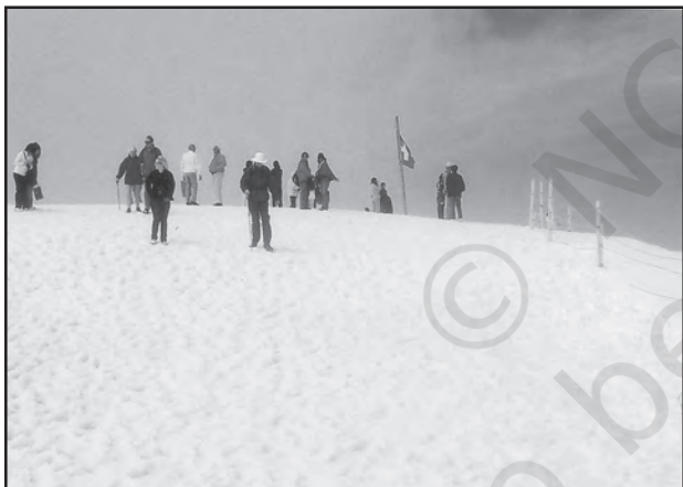
चित्र 6.5 : स्विट्जरलैंड में बर्फ से ढकी पर्वत चोटी पर स्कींग करते पर्यटक

पर्यटन एक यात्रा है जो व्यापार की बजाय प्रमोद के उद्देश्यों के लिए की जाती है। कुल पंजीकृत रोजगारों तथा कुल राजस्व (सकल घरेलू उत्पाद का 40 प्रतिशत) की दृष्टि से यह विश्व का अकेला सबसे बड़ा (25 करोड़) तृतीयक क्रियाकलाप बन गया है। इनके अतिरिक्त पर्यटकों के आवास, भोजन, परिवहन, मनोरंजन तथा विशेष दुकानों जैसी सेवा उपलब्ध कराने के लिए अनेक स्थानीय व्यक्तियों को नियुक्त किया जाता है। पर्यटन अवसंरचना उद्योगों, फुटकर व्यापार तथा शिल्प उद्योगों (स्मारिका) को पोषित करता है। कुछ प्रदेशों में पर्यटन ऋतुनिष्ठ होता है क्योंकि अवकाश की अवधि अनुकूल मौसमी दशाओं पर निर्भर करती है, किंतु कई प्रदेश वर्षपर्यंत पर्यटकों को आकर्षित करते हैं।