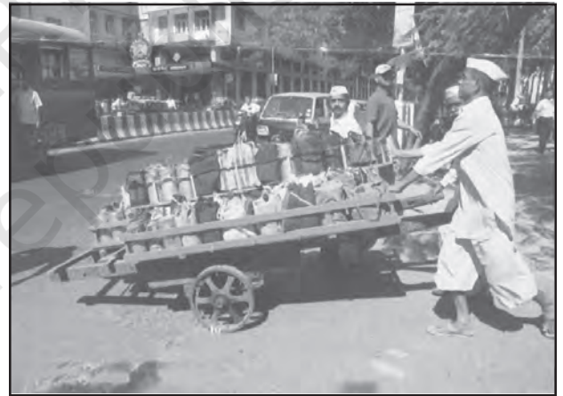
चित्र 6.4 : मुंबई में डब्बावाला सेवा

दैनिक जीवन में काम को सुविधाजनक बनाने के लिए लोगों को व्यक्तिगत सेवाएँ उपलब्ध कराई जाती हैं। कामगार रोजगार की तलाश में ग्रामीण क्षेत्रों से प्रवास करते हैं और अकुशल होते हैं। वे मोची, गृहपाल, खानसामा और माली जैसी घरेलू सेवाओं के लिए नियुक्त किए जाते हैं और इन्हें कम भुगतान किया जाता है। कर्मियों का यह वर्ग असंगठित है। ऐसा एक उदाहरण मुंबई की डब्बावाला सेवा है जो पूरे नगर में लगभग 1,75,000 उपभोक्ताओं को उपलब्ध कराई जाती है।