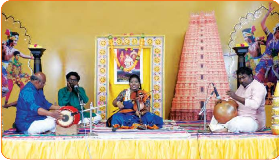
دائیں سے بائیں مردنگ، مورسنگ، وائلن اور گھاتم پر مشتمل گلوکاروں کا ایک گروہ۔