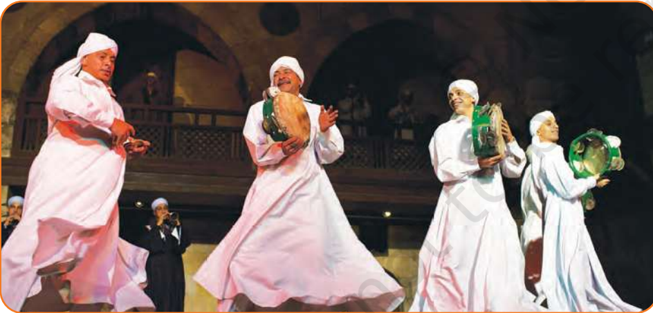
درویشانہ پیش کش پر رقص کرتے ہوئے صوفی

ہندوستان میں بھکتی موسیقی کی جڑیں بھکتی تحریک سے وابستہ ہیں۔ یہ ایک اہم مذہبی، سماجی اور ادبی تحریک ہے جو ہندوستان بھر میں چھٹی صدی عیسوی سے شروع ہوئی اور پندرہویں - سترہویں صدی عیسوی کے دوران اپنے عروج پر پہنچی۔ یہ تحریک عقیدت پر زور دیتے ہوئے ایک روحانی حیات نو کا باعث ہوئی اور اس نے ہندوستانی موسیقی کو نمایاں طور پر متاثر کیا۔ جس کے نتیجے میں موسیقی کی نئی شکلیں جیسے کیرتن اور بھجن کی تخلیق ہوئی۔ کچھ ممتاز بھکتی شاعروں میں شمالی ہندوستان میں میرابائی اور تلسی داس اور جنوبی ہندوستان میں ہری داس سنت جیسے پورندر داس اور کنک داس شامل ہیں۔