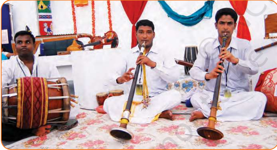
نادرورم بجاتے ہوئے فن کار — جنوبی ہندوستان کا دو نلی سراخوں والا ساز