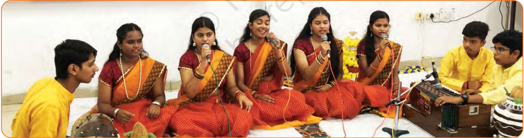
اجتماعی گیت گاتے ہوئے طلبا

|| ، ، ما-پا ، گا || رے ، ما-گا ، پا || am vith ، Se || li aa gish Bho