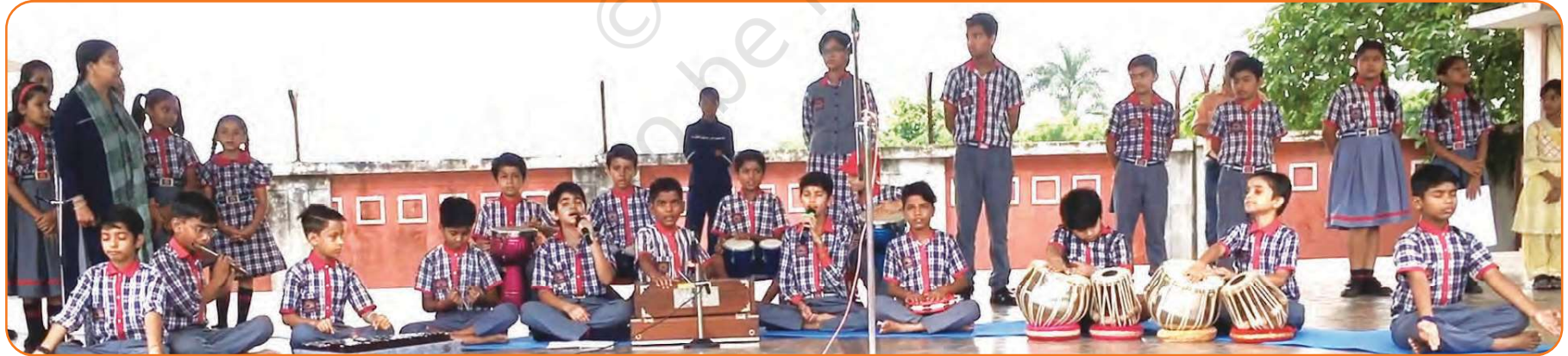
گانے ہوئے اور ساز بجاتے ہوئے طلبا