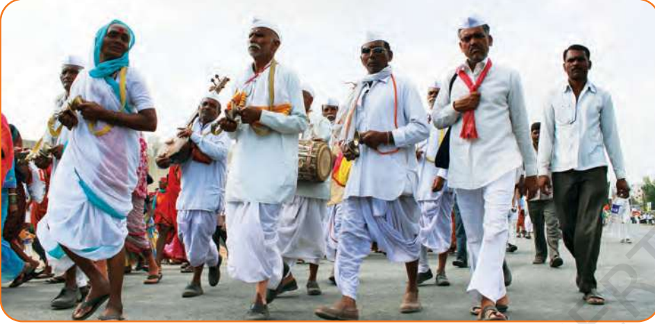
ورکری (زائرین) بھجن گاتے ہوئے