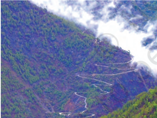
चित्र 7.3 – पहाड़ी रास्ते