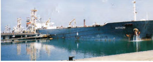
चित्र 7.7 – न्यू-मंगलौर पत्तन पर टैंकर द्वारा कच्चे तेल का निर्वहन

पत्तन की सुविधा भी प्रदान कर सके। लौह-अयस्क के निर्यात के संदर्भ में मुरगांव पत्तन देश का महत्वपूर्ण पत्तन है। यहाँ से देश के कुल निर्यात का आधा (50 प्रतिशत) लौह-अयस्क निर्यात किया जाता है। कर्नाटक में स्थित न्यू-मैंगलोर पत्तन कुद्रेमुख खानों से निकले लौह-अयस्क का निर्यात करता है। सुदूर दक्षिण-पश्चिम में कोचीन पत्तन है; यह एक लैगून के मुहाने पर स्थित एक प्राकृतिक पोताश्रय है।