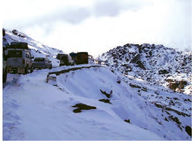
चित्र 7.4 – उत्तरी-पूर्वी सीमा सड़क पर यातायात (अरुणाचल प्रदेश)