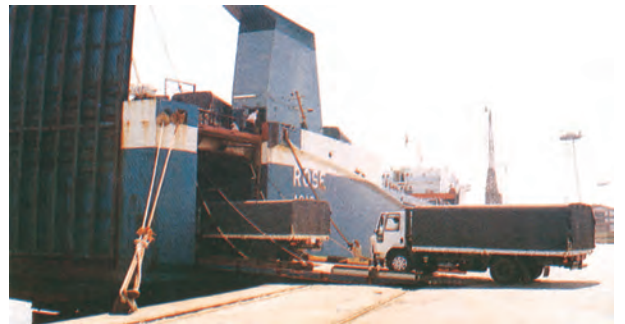
चित्र 7.6 – मुंबई पत्तन में जहाज पर ट्रकों को ले जाते हुए

मुंबई वृहत्तम पत्तन है जिसके प्राकृतिक खुले, विस्तृत व सुचारु पोताश्रय हैं। मुंबई पत्तन के अधिक परिवहन को ध्यान में रखकर इसके सामने जवाहरलाल नेहरू पत्तन विकसित किया गया जो इस पूरे क्षेत्र को एक समूह