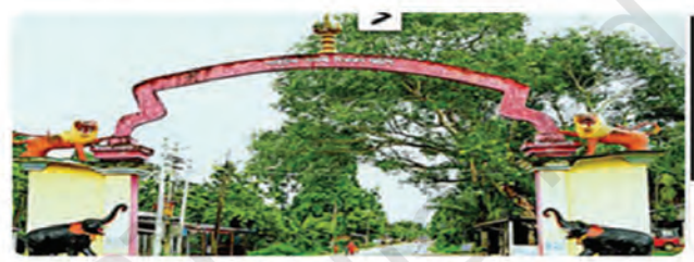
The entrance to Biswanath Ghat

Assam's Biswanath Ghat has been named the Best Tourism Village of India 2023. The village, located on the northern bank of the Brahmaputra, is known for its cluster ... Read More