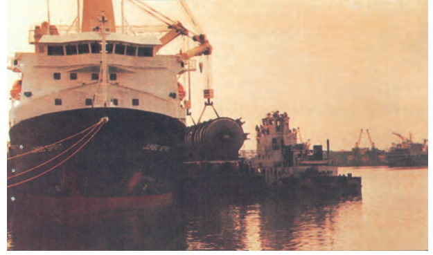
चित्र 7.8 – बड़े आकार के कार्गो को उठाने-रखने की सुविधाओं से युक्त वी.ओ. चिदंबरनार (तूतीकोरन) पत्तन

पूर्वी तट के साथ तमिलनाडु में दक्षिण-पूर्वी छोर पर वी.ओ. चिदंबरनार (तूतीकोरन) पत्तन है। यह एक प्राकृतिक पोताश्रय है तथा इसकी पृष्ठभूमि भी अत्यंत समृद्ध है। अतः यह पत्तन हमारे पड़ोसी देशों जैसे – श्रीलंका, मालदीव आदि तथा भारत के तटीय क्षेत्रों की भिन्न वस्तुओं के व्यापार को संचालित करता है। चेन्नई हमारे देश का प्राचीनतम कृत्रिम पत्तन है। व्यापार की मात्रा तथा लदे सामान के संदर्भ में इसका मुंबई के बाद दूसरा स्थान है। विशाखापट्टनम स्थल से घिरा, गहरा व सुरक्षित पत्तन है। प्रारम्भ में यह पत्तन लौह-अयस्क निर्यातक के रूप में विकसित किया गया था। ओडिशा में स्थित पारादीप पत्तन विशेषतः लौह-अयस्क का निर्यात करता है। श्यामाप्रसाद मुखर्जी, कोलकाता एक अंतः स्थलीय नदीय (Riverine) पत्तन है। यह पत्तन गंगा-ब्रह्मपुत्र बेसिन के वृहत् व समृद्ध पृष्ठभूमि को सेवाएँ प्रदान करता है। ज्वारीय (Tidal) पत्तन होने के कारण तथा हुगली के तलछट जमाव से इसे नियमित रूप से साफ करना पड़ता है। कोलकाता पत्तन पर बढ़ते व्यापार को कम करने हेतु हल्दिया सहायक पत्तन के रूप में विकसित किया गया है।