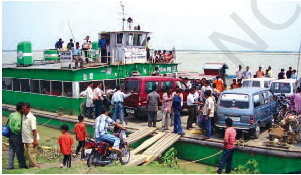
चित्र 7.5 – उत्तर-पूर्वी राज्यों में आंतरिक जलमार्ग परिवहन अधिक महत्वपूर्ण है

भारत के लोग प्राचीनकाल से समुद्री यात्राएँ करते रहे हैं। इसके नाविकों ने दूर तथा पास के क्षेत्रों में भारतीय संस्कृति व व्यापार को फैलाया है। जल परिवहन, परिवहन का सबसे सस्ता साधन है। यह भारी व स्थूलकाय वस्तुएँ ढोने में अनुकूल है। यह परिवहन साधनों में ऊर्जा सक्षम तथा पर्यावरण अनुकूल है। भारत में अंतः स्थलीय नौसंचालन जलमार्ग 14,500 किमी. लंबा है। एक देशव्यापी जलमार्ग नेटवर्क बनाने के लिए और देश में अंतर्देशीय जल परिवहन को रेल और सड़क परिवहन के एक किफायती, पर्यावरण अनुकूल पूरक माध्यम के रूप में बढ़ावा देने के लिए, 111 अंतर्देशीय जलमार्गों (पहले घोषित किए गए 5 राष्ट्रीय जलमार्गों सहित) को राष्ट्रीय जलमार्ग अधिनियम, 2016 द्वारा राष्ट्रीय जलमार्ग (NW) घोषित किया गया है (स्रोत: वार्षिक रिपोर्ट, पत्तन, पोत परिवहन और जलमार्ग मंत्रालय, भारत सरकार, 2023-24)।