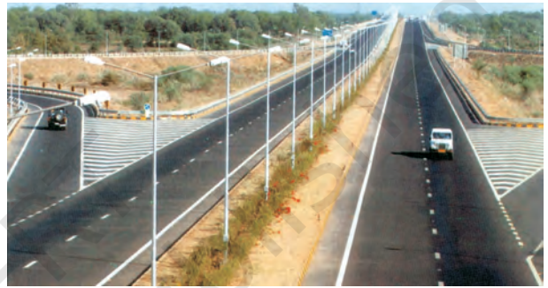
चित्र 7.1 – अहमदाबाद-वडोदरा द्रुतमार्ग