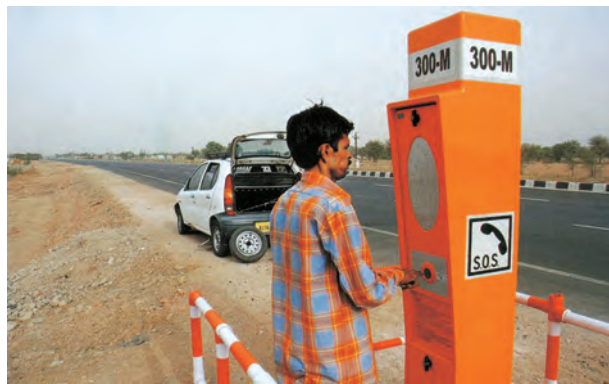
चित्र 7.10 - राष्ट्रीय राजमार्ग-48 पर एक आपातकालीन कॉल बॉक्स

डिजिटल भारत एक ज्ञान आधारित परिवर्तन के लिए, भारत को तैयार करने के लिए एक विशाल कार्यक्रम है। डिजिटल भारत कार्यक्रम का मुख्य उद्देश्य IT (भारतीय प्रतिभा) +IT (सूचना प्रौद्योगिकी)=IT (कल का भारत) में होने वाले परिवर्तन को समझना है और तकनीक को केन्द्र में रखकर बदलाव लाना है।