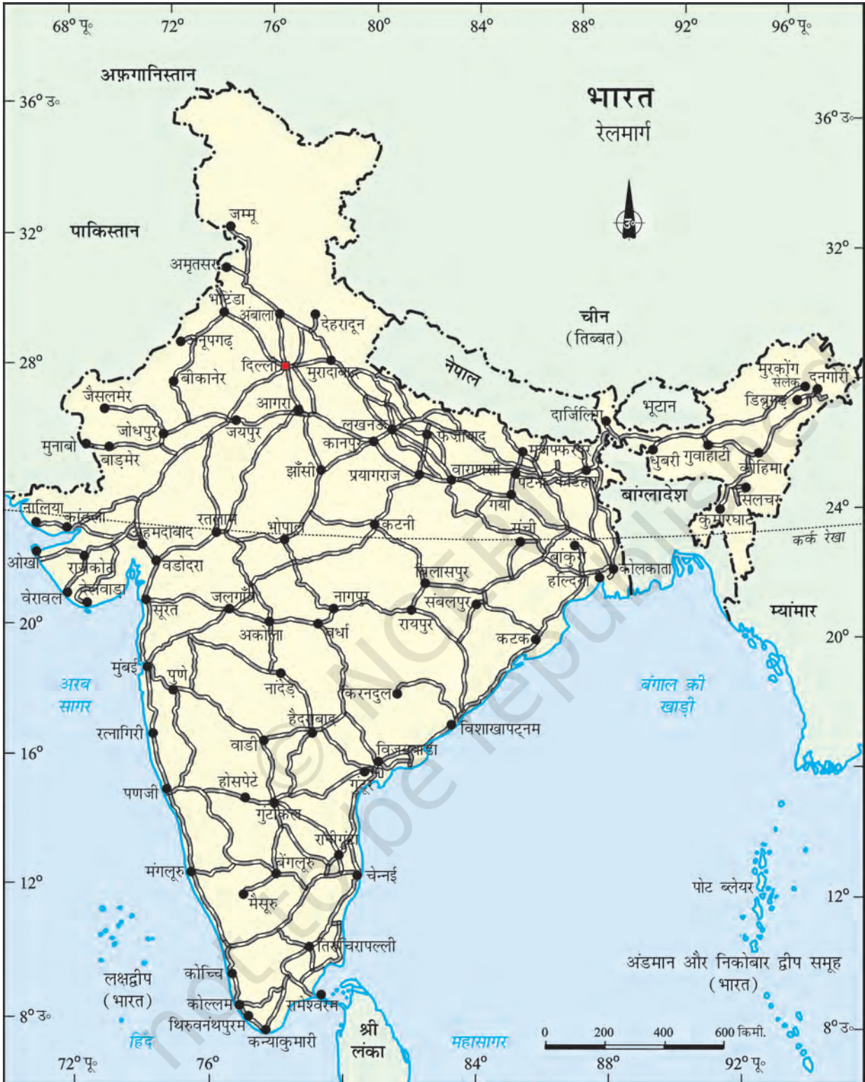
भारत - रेलमार्ग