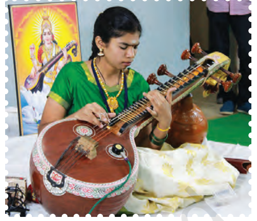
चित्र 8.9— वीणा