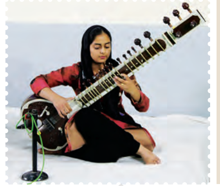
चित्र 8.8— सितार बजाते हुए कलाकार

सर्वप्रथम वैदिक काल में हमें सांगीतिक वाद्यों का वर्णन मिलता है, जिससे यह सिद्ध होता है कि उस काल में विभिन्न प्रकार के वाद्यों का विकास हो चुका था। रामायण काल में वीणा और मृदंग द्वारा नृत्य की संगति का उल्लेख प्राप्त होता है तथा महाभारत काल में महती वीणा, वेणु, दुंदुभि, पुष्कर आदि वाद्यों का वर्णन मिलता है।