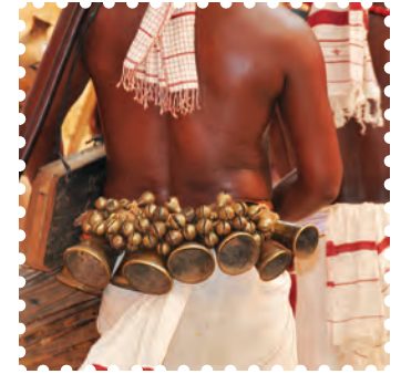
चित्र 8.26— घुँघरू व घंटी