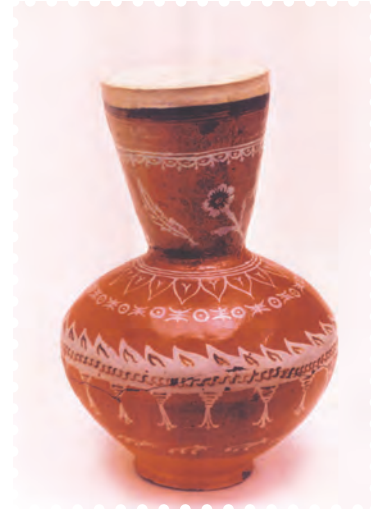
चित्र 8.3— घन वाद्य हुडक्कु