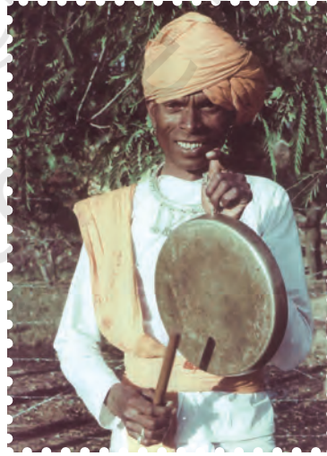
चित्र 8.2— घन वाद्य थाली