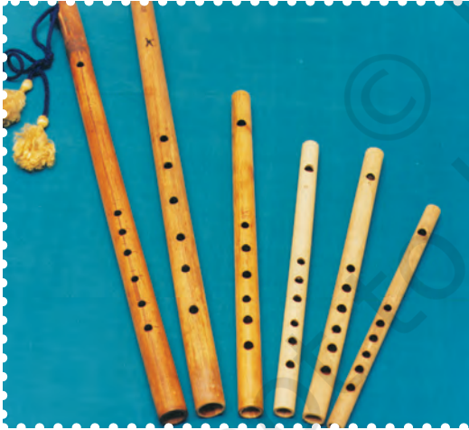
चित्र 8.28— बाँसुरी के विभिन्न प्रकार

भारतीय संगीत परंपरा में बाँसुरी अत्यंत प्राचीन काल से ही प्रचलित रही है। ऋचा के गायन के समय बाँसुरी सर्वाधिक प्रमुख संगत वाद्य मानी जाती थी। आज यह शास्त्रीय, उपशास्त्रीय, सुगम, लोक एवं फिल्म संगीत का अभिन्न अंग बन चुकी है। बाँसुरी को पूरे भारत में विभिन्न नामों से जाना जाता है—