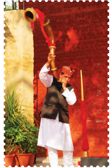
चित्र 8.7— हिमाचली शहनाई हेस्सी