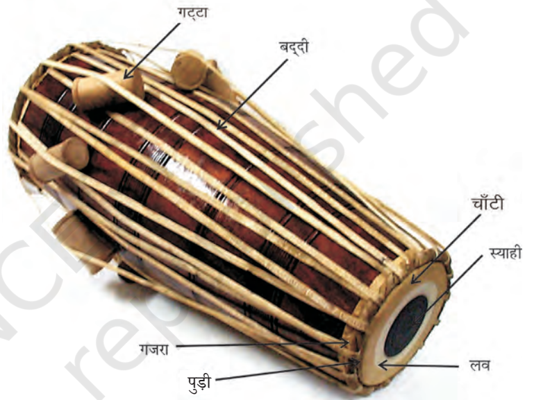
चित्र 8.17— पखावज

पखावज के दोनों मुखों पर चमड़े की पुड़ी लगी होती है जो गजरे के साथ बद्धियों द्वारा आपस में कसी जाती है। इसकी पुड़ी में बकरे के चमड़े का प्रयोग किया जाता है और बद्धियाँ भैंस या ऊँट के चमड़े से बनाई जाती हैं। पखावज को आवश्यकतानुसार स्वर में मिलाने के लिए इसके गजरे पर 16 घर होते हैं। इनकी सहायता से स्वर को चढ़ाकर या उतारकर वाद्य को मिलाने हैं। इसकी बद्धियों में लकड़ी के आठ गट्टे फँसे होते हैं जो वाद्य को मिलाने में मदद करते हैं। स्याही और चाँटी के बीच जो खुला स्थान रहता है, उसे 'लव' या 'मैदान' कहते हैं। पखावज की ध्वनि अधिक जोरदार, गूँजमय और आँसदार होती है। दक्षिण के मृदंगम् और उत्तर के पखावज में सबसे बड़ा अंतर इसके आकार का होता है। पखावज वाद्य मृदंगम् से बड़ा होता है। पखावज में मुख्य रूप से चौताल, धमार, सूलताल, आदिताल, तीव्रा, बसंत, लक्ष्मी आदि तालों का प्रयोग किया जाता है।