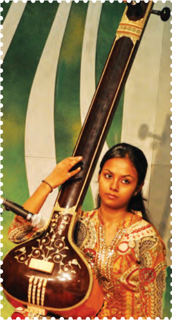
चित्र 8.10— तानपुरा

तत् वाद्य वे वाद्य यंत्र होते हैं जिन पर तार या तंत्री के कंपन से स्वर उत्पन्न किए जाते हैं। ये कंपन तार पर आघात या घर्षण द्वारा उत्पन्न किए जाते हैं। तत् श्रेणी के अंतर्गत वे वाद्य आते हैं जिन्हें अँगुलियों, मिजराब या जवा आदि से आघात कर अथवा गज से घर्षण कर बजाते हैं। इसके अंतर्गत तानपुरा, वीणा, सितार, सरोद, वाँयलिन, सारंगी, इसराज आदि वाद्य आते हैं।