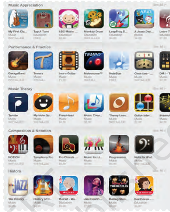
चित्र 8.33—म्यूज़िकल ऐप्स

ऐप का पूरा नाम ऐप्लीकेशन होता है जो एक सॉफ्टवेयर का रूप है। यह एक निर्धारित कार्य प्रणाली के तहत कार्य करता है। संगीत की दृष्टि से, जैसे— गाना सुनने का ऐप, गाना रिकार्ड करने का ऐप, गाने को संगीतमय बनाने का ऐप, यह किसी भी प्रकार का हो सकता है। ऐप को इलेक्ट्रॉनिक डिवाइस, जैसे— मोबाइल, लैपटॉप आदि में इस्तेमाल किया जाता है। इसमें तानपुरा, नगमा, संगति के लिए ठेके आदि की सुविधा सुरीलेपन के साथ उपलब्ध रहती है।