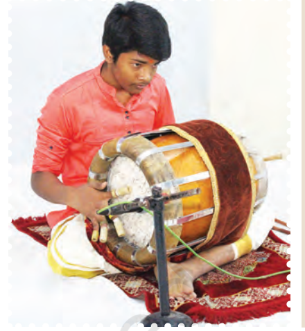
चित्र 8.19— थविल बजाते हुए कलाकार

इसके मुखों पर चमड़े की इकहरी परत का प्रयोग किया जाता है। दाहिने मुख पर गाय या भैंस का चमड़ा एवं बाएँ मुख पर बकरे के चमड़े का प्रयोग किया जाता है। दाहिने मुख के चमड़े को अधिक कसा जाता है, जबकि बाएँ मुख के चमड़े को थोड़ा ढीला रखते हैं और भीतर की ओर से लेप लगाया जाता है। दोनों मुखों को ढाँचे पर मढ़ने के लिए छह से सात बाँस की पतली पट्टियों तथा जूट व चमड़े से निर्मित गोलाकार चक्र का उपयोग किया जाता है। वर्तमान में लोहे के खोखले रिंग का भी प्रयोग देखने को मिलता है। दोनों मुखों के चमड़ों को इन गोल चक्रों की सहायता से ढाँचे पर लगा देते हैं और भैंस के चमड़े की मोटी बद्धी द्वारा मज़बूती से कस देते हैं। इसकी बद्धियों को कसने के लिए मध्य भाग में चमड़े की चौड़ी बद्धी का प्रयोग किया जाता है। इस वाद्य को किसी विशेष स्वर में मिलाने की सुविधा नहीं होती। इसकी आवाज़ बहुत तीव्र होती है।