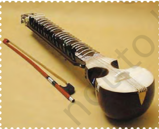
चित्र 8.14— इसराज

उत्तर भारतीय संगीत में भी सम्मिलित किया गया। उत्तर में स्वर्गीय पंडित वी.जी. जोग और विदुषी एन. राजम तथा दक्षिण में डॉ. एल. सुब्रमनियम, एम.एस. गोपालकृष्णन, टी.एन. कृष्णन और लालगुड़ी जयरामन् वॉयलिन के प्रख्यात वादक हुए। भारत में वॉयलिन संगत एवं स्वतंत्र दोनों शैलियों में बजाया जाता है। दक्षिण भारतीय संगीत में वॉयलिन का प्रयोग एकल वादन के साथ-साथ मुख्यतः संगत वाद्य के रूप में होता है लेकिन उत्तर भारत में वॉयलिन एकल वादन और संगीत दोनों के लिए लोकप्रिय है।