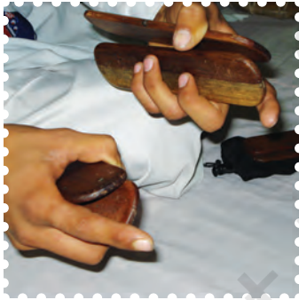
चित्र 8.24— करताल

घन वाद्य मूलतः लकड़ी, काँसा, पीतल आदि धातु के बने हुए होते हैं, जिन्हें आपस में टकराकर या डंडियों के प्रहार से बजाते हैं। इनका मुख्य कार्य लय धारण करना होता है। लोक संगीत में इनका प्रयोग अधिक होता है। इसके अंतर्गत आने वाले वाद्य हैं— घंटा, घंटी, झाँझ, करताल, मंजीरा, घुँघरू, मुरचंग आदि।