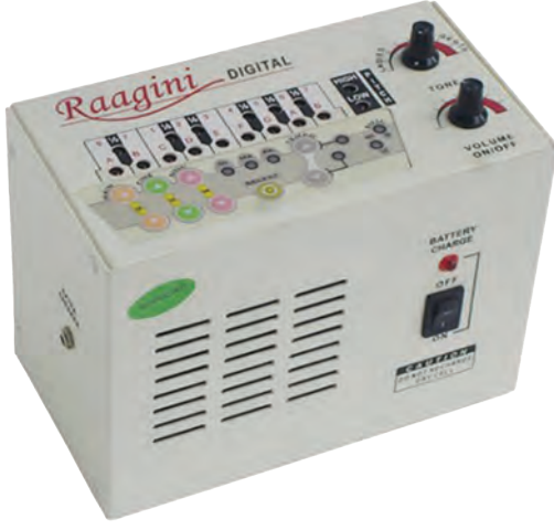
चित्र 8.30— इलेक्ट्रॉनिक तानपुरा

तानपुरे में टोन और वॉल्यूम को नियंत्रित करने के लिए एक या अधिक स्विच या बटन होते हैं। स्विच के द्वारा एक निश्चित स्वर या स्केल और वॉल्यूम स्थापित किया जाता है। इसकी स्वर सीमा आमतौर पर एक से दो सप्तक होती है। स्वर या स्केल को बदलना, तानपुरा के चार तारों की गति में बदलाव लाना और मध्यम एवं पंचम स्वरों को राग के अनुसार बदलने के सभी विकल्प इलेक्ट्रॉनिक तानपुरे में होते हैं। इलेक्ट्रॉनिक तानपुरे का आविष्कार जी. राज नारायण ने सन् 1979 में किया था। पहला संस्करण कैपेसिटर, ट्रांजिस्टर का उपयोग करके, तब की उपलब्ध तकनीक के आधार पर बना था। 1990 के दशक के उत्तरार्ध में, एक चिप पर पारंपरिक तानपुरा की सैंपल रिकॉर्डिंग का उपयोग करके इसके विभिन्न मॉडल तैयार किए गए थे। सन् 2000 के दशक में इलेक्ट्रॉनिक तानपुरा को भी एन्ड्रॉएड मोबाइल ऐप्लीकेशन में विकसित कर लिया गया, जिसे आज भी हम इस्तेमाल करते हैं। अधिकांश संगीतकारों के लिए इलेक्ट्रॉनिक तानपुरा एक अत्यंत सुविधाजनक व्यावहारिक यंत्र है।