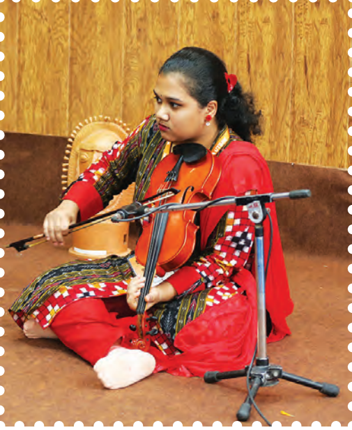
चित्र 8.13— वॉयलिन बजाते हुए कलाकार