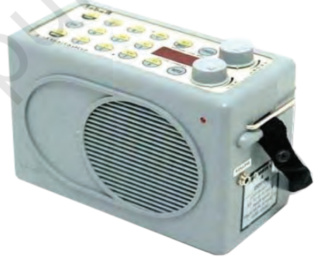
चित्र 8.31— श्रुति बॉक्स या सुरपेटी

श्रुति बॉक्स (श्रुति बॉक्स या सुरपेटी) एक इलेक्ट्रॉनिक गैजट है। इसका उपयोग अभ्यास के दौरान या संगीत कार्यक्रमों में एक ड्रोन (एक स्थायी स्वर) प्रदान करने के लिए किया जाता है। श्रुति बॉक्स का उपयोग शास्त्रीय गायन में निरंतर किया जाता है। तमिल और तेलुगू में इसे 'श्रुति पेटी' और हिंदी में 'सुर पेटी' कहते हैं।