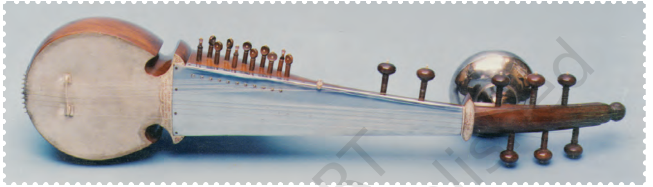
चित्र 8.12— सरोद

है। ऊपर की ओर बढ़ने पर यह वाद्य यंत्र पतला होता जाता है। दूसरा मध्य खंड है, जो स्टील की प्लेट से ढका होता है। यह वह भाग है जिस पर तारों को उस धातु की प्लेट में दबाते हुए बायाँ हाथ चलाया जाता है। सरोद का तीसरा खंड खोखला होता है जिसे 'तुम्बी' कहते हैं। यह आकार में गोल तथा बकरे की त्वचा की झिल्ली से ढका हुआ होता है। इस बकरे की खाल वाले भाग के मध्य ही 'घोड़ी' या 'ब्रिज' लगी होती है। सरोद में आठ मुख्य तार होते हैं जो ब्रिज के ऊपर से होते हुए वाद्य-यंत्र के दूसरे छोर पर लगी खूंटियों में बँधे होते हैं। ब्रिज में एक छिद्रित भाग होता