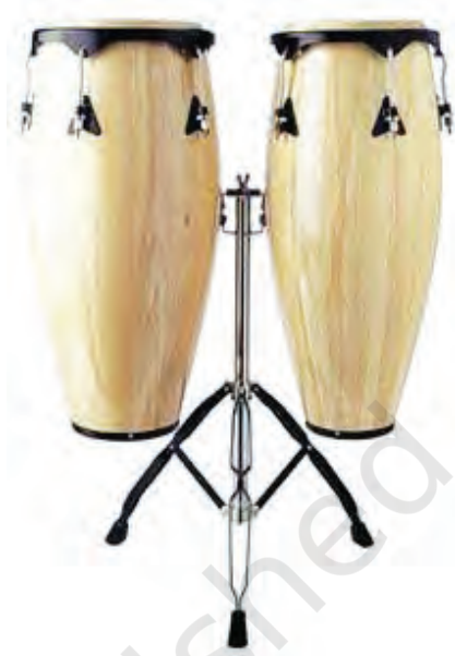
चित्र 8.23— कौंगो

कौंगो वाद्य बौंगो से आकार में काफी बड़ा होता है। कौंगो के तीन भाग होते हैं। ये तीनों भाग क्रम से, बड़े, मध्यम और छोटे आकार के होते हैं। प्रत्येक भाग की ऊँचाई बराबर होती है, लेकिन बौंगो की तुलना में अधिक होती है। तीनों भागों के मुखों के व्यास क्रमशः बड़े, मध्यम और छोटे होते हैं। इन तीनों मुखों पर क्रमशः मोटी, मध्यम और पतले चमड़े की पुड़ी चढ़ाई जाती है। बौंगो के समान ही पुड़ी को स्टील की रिंग में फँसाकर इसके मुख पर लगाया जाता है। रिंग के किनारों पर चार दिशाओं में चार स्टील की छड़ें फँसी होती हैं जो नीचे की तरफ़ पेंच द्वारा कसी जाती हैं। कौंगो को सुविधानुसार अलग-अलग स्वरों में मिलाया जा सकता है। कौंगो के तीनों भाग आपस में जुड़े होते हैं। इन्हें खड़ा करने के लिए नीचे स्टैंड लगा होता है। इसे खड़े होकर बजाया जाता है।