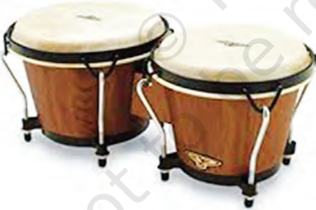
चित्र 8.22— बौंगो

बौंगो और कौंगो मूलतः अफ्रीकी वाद्य हैं। इनका प्रयोग अधिकतर भारतीय फ़िल्म संगीत में किया जाता है। बौंगो एक छोटा-सा अवनद्ध वाद्य है। इसमें तबला वाद्य के समान दायाँ और बायाँ दो भाग होते हैं जो आपस में एक-दूसरे से जुड़े होते हैं। इसका बायाँ मुख बड़ा और दायाँ मुख छोटा होता है। छोटे मुख पर पतली तथा बड़े मुख पर मोटे चमड़े की पुड़ी चढ़ाई जाती है। पुड़ी के किनारे को स्टील के रिंग में फँसाकर मुख पर कस दिया जाता है। रिंग के किनारों पर चार दिशाओं में चार स्टील की छड़ें फँसी होती हैं जो नीचे की तरफ पेंच द्वारा कसी जाती हैं। इन पेंचों की मदद से पुड़ी को ऊँचे या नीचे स्वर में मिलाया जा सकता है। बौंगो अधिकतर कुर्सी या स्टूल पर बैठकर बजाया जाता है। बजाते समय इसे दोनों घुटनों के बीच आगे की तरफ झुकाकर फँसा लेते हैं जिससे बजाने में सुविधा रहती है। ऊँची ध्वनि निकालने के लिए एक अँगुली का तथा नीची ध्वनि निकालने के लिए तीन या चार अँगुलियों को जोड़कर थाप जैसे आघात का प्रयोग किया जाता है। बौंगो के दोनों भागों में किसी भी एक भाग पर दोनों हाथों की अँगुलियों का प्रयोग वादन के लिए किया जा सकता है।