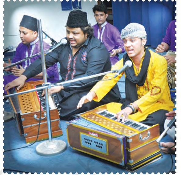
चित्र 8.29— हारमोनियम बजाते हुए कलाकार

हारमोनियम संभवतः भारत में सबसे अधिक प्रयोग किये जाने वाले वाद्ययंत्रों में से एक है। यह क्षेत्रीय, फिल्म, प्रकाश और शास्त्रीय संगीत का हिस्सा बन गया है। ऑर्गन या हारमोनिका की भाँति हारमोनियम भी एक स्वतंत्र रीड वाद्य है। हारमोनियम में मुख्यतः चार भाग होते हैं— धौंकनी, वायु कक्ष, कुँजियाँ और रीड। हारमोनियम के ऊपर शीर्ष पर एक कीबोर्ड होता है जिसमें लगभग तीन से साढ़े तीन सप्तक कीज (keys) होती हैं। वादक एक हाथ से कीबोर्ड बजाते हैं व दूसरे हाथ से धौंकनी की सहायता से हवा भरकर हारमोनियम वादन करते हैं। धौंकनी के निरंतर और बार-बार धौंकने से, भीतर हवा का दबाव ऊपर उठता है और हारमोनियम कीबोर्ड पर लगी सफेद और काली चाबियों को दबाकर उस हवा को छोड़ा जाता है। प्रत्येक की (key) में एक ही रीड होती है। एक की (key) दबाने से कनेक्टिंग रीड के नीचे एक छोटा-सा वेंट (वायु आदि निकलने का मार्ग) खुल जाता है जिसके माध्यम से हवा गुजरती है, इस प्रकार आवश्यक स्वर की उत्पत्ति होती है।