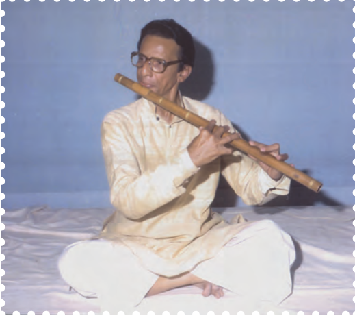
चित्र 8.27— सुषिर वाद्य— बाँसुरी बजाते हुए कलाकार

घटा-बढ़ाकर स्वर ऊँचा-नीचा किया जाता है। इसके अंतर्गत बाँसुरी, शहनाई, शंख, नागस्वरम्, क्लेरोनेट, सैक्सोफ़ोन, हारमोनियम, ऑर्गन, माउथ ऑर्गन, एकाॅर्डियन आदि वाद्य आते हैं।