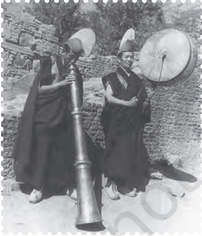
चित्र 8.6— राडोन्ग एवं सिक्किम का ड्रम

कंठ संगीत हो, नृत्य हो या नाटक इन सभी कलाओं की प्रस्तुति में विस्तार के लिए, अपनी कला में आकर्षण पैदा करने के लिए तथा श्रोताओं को प्रभावित करने के लिए वाद्य यंत्रों की सहायता लेनी पड़ती है। साधारण श्रोताओं को भले ही वाद्य पर क्या बज रहा है इसका ज्ञान न हो, परंतु उस संगीत को सुनकर वह आनंद में डूब जाते हैं। गायन तथा अन्य कलाओं के माध्यम से अभिव्यक्त किए जा रहे भावों की प्रस्तुति में वाद्यों का एक महत्वपूर्ण स्थान है। जिस भाव और रस को शब्द