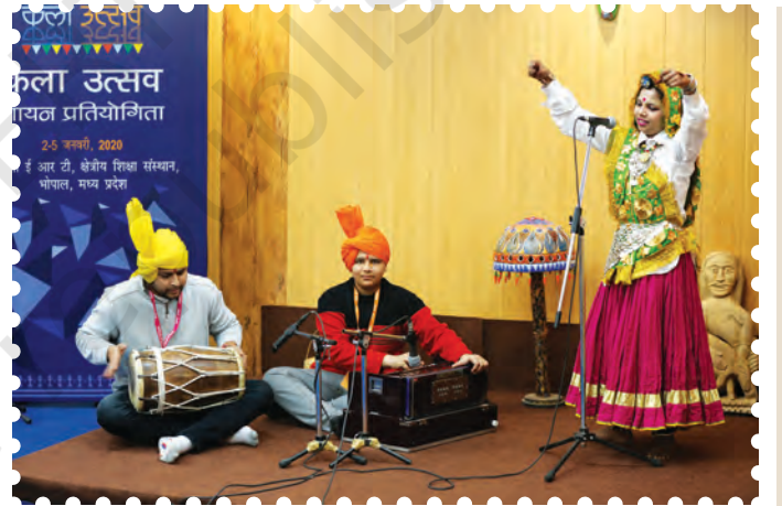
चित्र 8.20— हारमोनियम एवं ढोलक बजाते हुए कलाकार

ढोलक उत्तर भारतीय संगीत में प्रचलित एक प्रमुख लोक अवनद्ध वाद्य है। इसका प्रयोग लोक संगीत में गायन की संगति के लिए किया जाता है। इसके दो मुख होते हैं। इसकी लंबाई लगभग 45 सेंटीमीटर और मध्य का व्यास लगभग 27 सेंटीमीटर का होता है। इसका दायाँ मुख बाएँ मुख की तुलना में कुछ छोटा होता है। दोनों मुखों पर चमड़े की पुड़ी लगी होती है। दोनों पुड़ियाँ सूत की डोरी की सहायता से एक-दूसरे से कसी होती हैं। इन बद्धियों के बीच में लोहे के छल्ले लगे होते हैं जिनकी सहायता से ढोलक को कसा जाता है। बाएँ मुख से निकलने वाली ध्वनि को गंभीर करने के लिए इसमें चमड़े की भीतरी सतह पर एक विशेष प्रकार का लेप लगाया जाता है। इसे अँगुलियों से बजाते हैं।