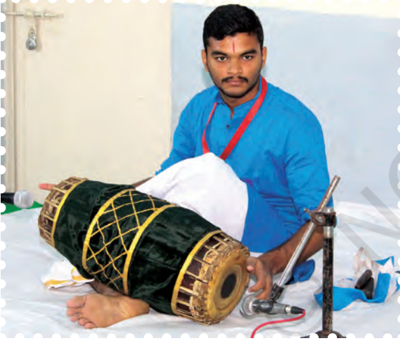
चित्र 8.18— मृदंगम् बजाते हुए कलाकार

चमड़े की तुलना में अधिक मोटा होता है। मृदंगम् के दाएँ मुख के किनारे का यह चमड़ा स्याही के स्थान को छोड़कर पुड़ी के पूरे हिस्से को घेरे रहता है। इस कारण मृदंगम् में चाँट और स्याही का भाग ही दिखाई देता है, जबकि पखावज की पुड़ी, चाँट, लव और स्याही इन तीन भागों में बँटी होती है। दक्षिण भारत में इस स्याही को 'सोरू' कहते हैं। इसे लौह चूर्ण, पके चावल आदि के मिश्रण से बनाते हैं। मृदंगम् का बायाँ मुख भी पखावज की तुलना में छोटा होता है, जिस पर सूजी की पूलिका लगाई जाती है। मृदंगम् के बाएँ मुख पर सूजी लगाने का स्थान छोटा रखा जाता है। मृदंगम् में दोनों मुखों की पुड़ियों को चमड़े की बद्धी से आपस में कसा जाता है, जिसे 'चटाई' या 'पिन्नल' कहते हैं। इसका दायाँ मुख ही मुख्य गायक या वादक के गाए जाने वाले स्वर में मिलाया जाता है।