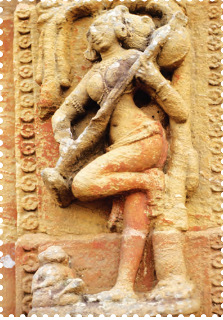
चित्र 8.5— प्राचीन कालीन वीणा (तत् वाद्य)

सांगीतिक वाद्यों का उपासना से बहुत गहरा संबंध रहा है इसीलिए मानव मन श्रीकृष्ण को बाँसुरी बजाते हुए, सरस्वती को वीणा, शंकर को डमरू तथा गणेश को मृदंग बजाते हुए ही अपनी कल्पनाओं और उससे निर्मित चित्रों तथा मूर्तियों में देखता है। इसके अलावा, मंदिरों में पूजा-अर्चना के समय घंटा, घंटी, शंख आदि का प्रयोग तथा मांगलिक कार्यों में शहनाई, ढोल, ढोलक, मंजीरा आदि का प्रयोग लोक जीवन में वाद्यों के महत्व को दर्शाते हैं। मानव शरीर को भी वाद्य यंत्र माना गया है तथा इसे 'गात्र वीणा' कहा गया है।