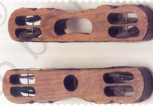
चित्र 8.25— खंजरी