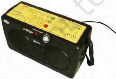
चित्र 8.32— इलेक्ट्रॉनिक तालमाला