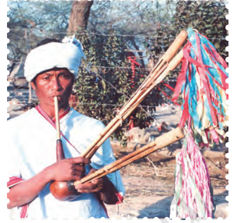
चित्र 8.4— रीड वाद्य

वाद्यों का प्रयोग विभिन्न युगों में अलग-अलग आवश्यकताओं की पूर्ति के लिए होता रहा है, जैसे— दूर बैठे व्यक्ति को संकेत देने के लिए, जंगली जानवरों को भगाने के लिए, शिकार के समय तथा उत्सव आदि में प्रसन्नता प्रकट करने के लिए वाद्यों का प्रयोग होता था। युद्ध भूमि में सैनिकों का हौसला बढ़ाने के लिए भी दुंदुभि, शंख, ढोल, ताशा आदि वाद्य यंत्रों का प्रयोग किया जाता था।