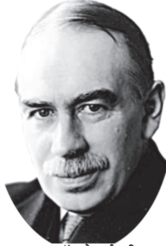
जॉन मेनार्ड कीन्स

ब्रिटिश अर्थशास्त्री जॉन मेनार्ड कीन्स का जन्म 1883 में हुआ था। उनकी शिक्षा किंग्स कॉलेज, कैंब्रिज यूनाइटेड किंगडम में हुई थी और बाद में 'विशेषज्ञ' के रूप में नियुक्त हुए। प्रथम विश्व युद्ध के वर्षों में वे तीक्ष्ण विद्वता के अलावा सक्रिय अंतर्राष्ट्रीय राजनायिक के रूप में भी जुड़े रहे। अपनी पुस्तक 'इकोनॉमिक कंसीक्वेसेज ऑफ द पीस' (1919) में युद्ध की शांति समझौते के भंग होने की भविष्याणी इन्होंने कर दी थी। उनकी पुस्तक 'जनरल थ्योरी ऑफ इंफ्लायमेंट, इंटरैस्ट एंड मनी' (1936) बीसवीं सदी की अर्थशास्त्र की महत्वपूर्ण पुस्तकों में से एक है। कीन्स विदेशी मुद्रा के समझदार सट्टेबाज थे।