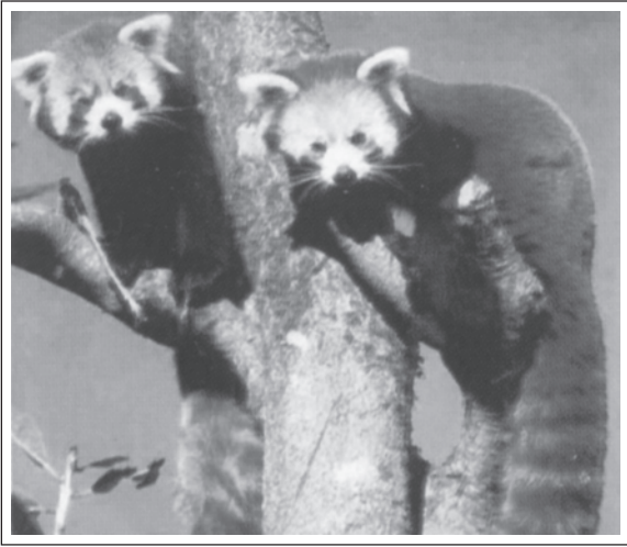
चित्र 14.2: रेड पांडा - एक संकटापन्न प्रजाति