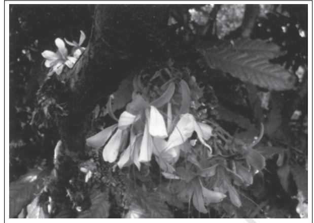
चित्र 14.3: हमबोशिया डेकरेंस बेड- दक्षिण पश्चिमी घाट ( भारत ) की एक दुर्लभ प्रजाति

विश्व की सभी संकटापन्न प्रजातियों के बारे में (Red list) रेड लिस्ट के नाम से सूचना प्रकाशित करता है।