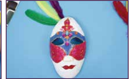
यसलाई रङ र अन्य कुनै सामग्रीले सजाउनुहोस्