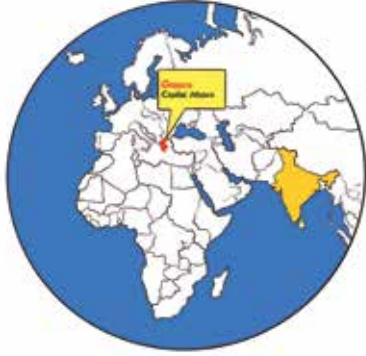
मापन गर्न नमिल्ने मानचित्र कलाकार को प्रतिनिधित्व