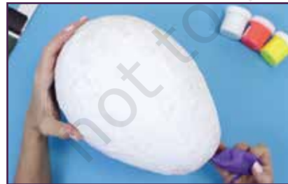
पूर्ण रूपमा सुकेपछि, यसलाई हटाउन बेलुन फुटाउनुहोस्