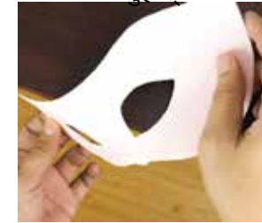
टेबुलको किनार प्रयोग गरेर कार्डबोर्डलाई थोरै मोड्नुहोस्।