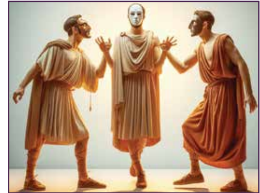
यूनानी नाटक को अभिनय

त्रासदी वास्तवमा गम्भीर र दुःखद छ । के ग्रीकहरू दुःखी हुन र सधैं रुन मन पराउँथे? होइन, यसले उनीहरूलाई