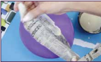
बेलुनमा भिजेको कागजका टुक्राहरू । - 5-6 परत । गोंदको साथ अन्तिम तह

सामान्यतया, एउटा मुखुण्डोले विभिन्न उद्देश्यहरू पूरा गर्दछ । प्रदर्शन कलाहरूमा मुखुण्डोहरूको धेरै तरिकाले प्रयोग गरिन्छ र यसलाई विभिन्न सांस्कृतिक उत्सवहरू र नाट्य परम्पराहरूमा देख्न सकिन्छ । कुनै पत्र, सांस्कृतिक प्रतीक वा कुनै गहिरो अर्थ व्यक्त गर्न चाहे पनि, मुखुण्डाहरू प्रदर्शन कलाको संसारमा एक शक्तिशाली र बहुमुखी उपकरण हुन् । भारतमा ५० भन्दा बढी प्रकारका मुखुण्डाहरू पहिचान गरिएका छन् ।