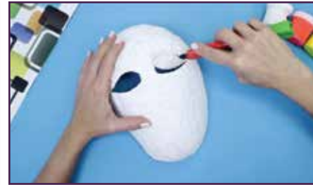
आकार परिभाषित गर्न रूपरेखा काट्नुहोस् (ठूलोको मद्दत लिनुहोस्)