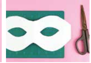
कैंचीले लाइनमा काट्नुहोस्