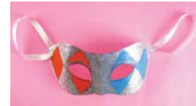
आफ्नो मास्कलाई रङ, खोल, प्वाँख वा आफूले चाहेको कुनै पनि चीजले सजाउनुहोस्