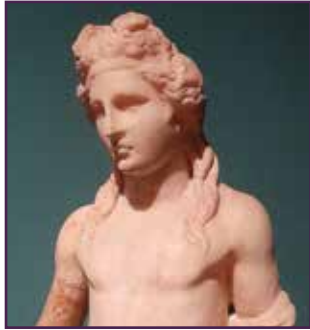
डायनोसिस — ग्रीक मनोरञ्जनको देवता

'ओड' एक घटना वा व्यक्तिको महिमाको लागि एक प्रकारको गीत कविता हो ।