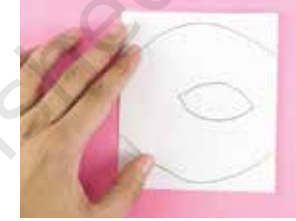
कागजलाई आधामा फोल्ड गर्नुहोस् र रेखाचित्र कोर्नुहोस्।