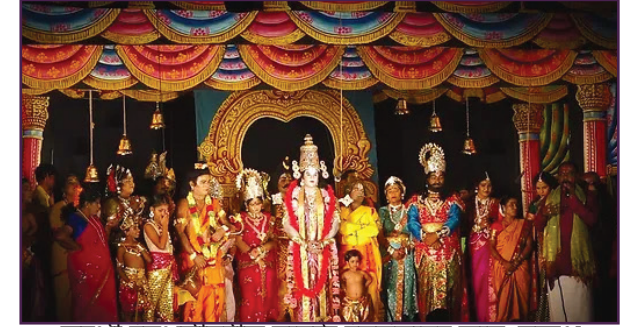
सुरभी रंगभूमीवरील नाटक रंगमंचावर जादू, प्रत्यक्ष व्हीएफएक्स आणि तर्काचा वापर करण्यासाठी ओळखली जातात.

लोकप्रिय कंपन्या, कार्यक्रम आणि कथा सुरभी थिएटर किंवा श्री व्यंकटेश्वर नाट्य मंडळाची स्थापना १८८५ मध्ये आंध्र प्रदेशात झाली. त्याचे पहिले नाटक म्हणजे कीचक वधा. ही एक कौटुंबिक रंगभूमी कंपनी आहे, जी हिंदू