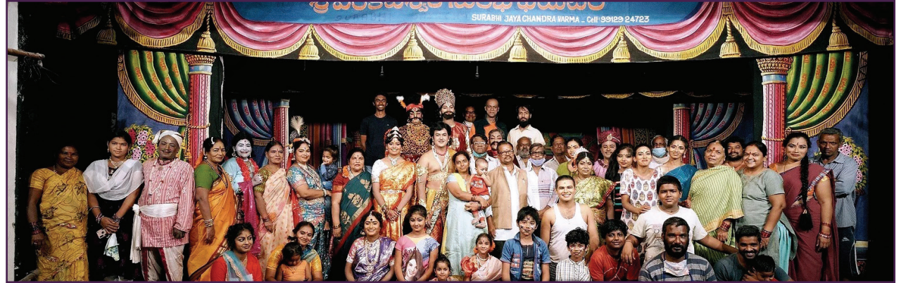
एका कार्यक्रमानंतर सहवास रंगभूमी समूह