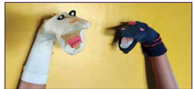
സോക്ക് പാവകളുടെ സംഭാഷണം