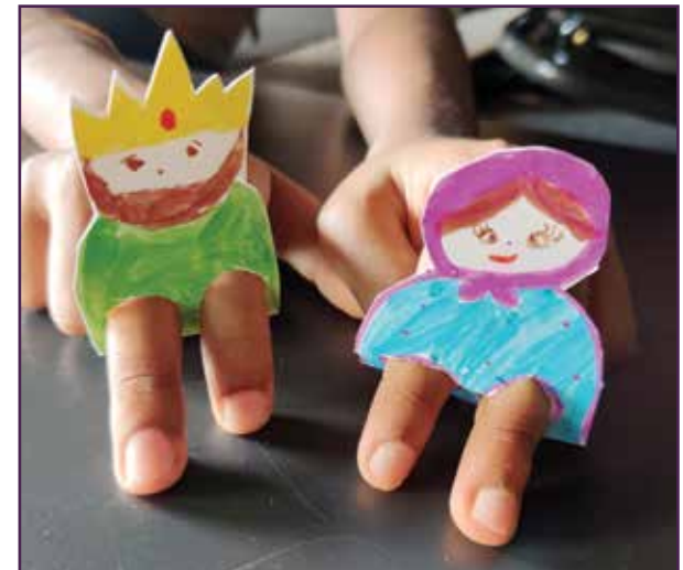
നിങ്ങളുടെ വിരലുകൾ കാലുകളായി ഉപയോഗിക്കുക