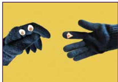
ഗ്ലോവ് പാവകളുടെ സംഭാഷണം

നിങ്ങളുടെ ക്ലാസിലോ നിങ്ങളുടെ കുടുംബത്തിലോ ഈ പരിപാടി അവതരിപ്പിക്കുക. നിങ്ങളിപ്പോൾ ഒരു പാവകളിക്കാരനാണ്!