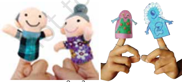
വിരൽ പാവകളുടെ സംഭാഷണം