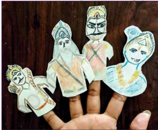
പുരാണത്തിലെയും ഇതിഹാസത്തിലെയും കഥാപാത്രങ്ങൾ