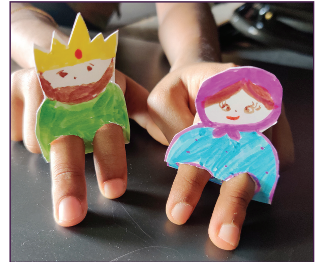
तुमच्या बोट्यांचा पायांसारखा वापर करा.