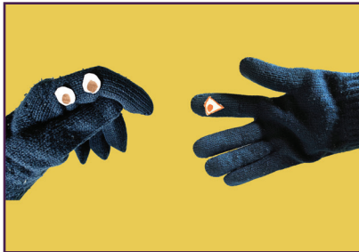
हाथमोजे कठपुतळी संभाषण

आपल्याला हवे तसे डोळे, जीभ, केस, नाक आणि इतर वैशिष्ट्ये घाला.