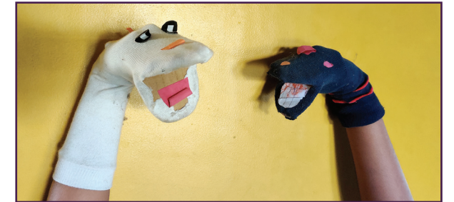
पायमोजे कठपुतळी संभाषण

हा शो तुमच्या वर्गात किंवा तुमच्या कुटुंबासमोर सादर करा. तू आता कठपुतळी आहेस!