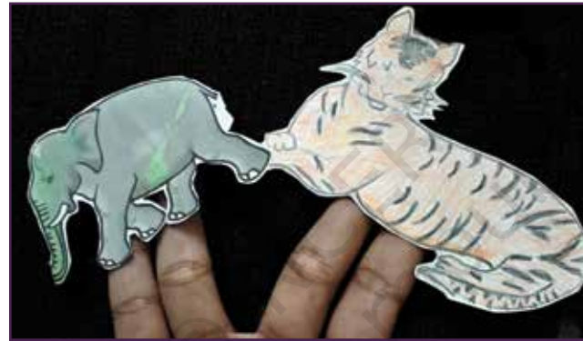
जानवर को पात्र

कठपुतली कसरी बनाउनुपर्छ भन्ने कुनै सीमा वा नियम हरू नभएकोले, तपाईंको कठपुतलीलाई जीवित बनाउन विभिन्न तरिकाहरू प्रयास गर्नुहोस्!