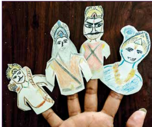
पुराण र इतिहासका पात्रहरू