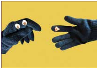
दस्ताने कठपुतली वार्तालाप गर्नुहोस्