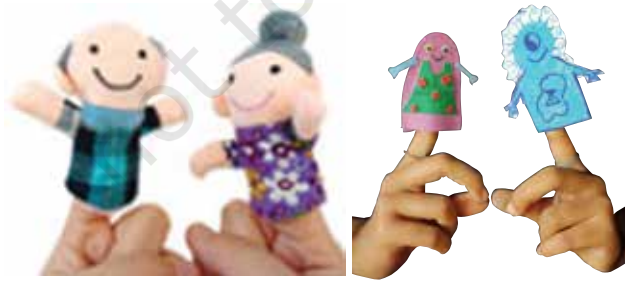
औंला कठपुतली वार्तालाप