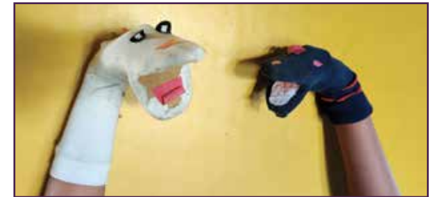
मोजा कठपुतली वार्तालाप

आफ्नो कक्षा मा वा आफ्नो परिवार मा यो प्रस्तुत गर्नुहोस् । अब तपाईं एउटा कुशल कठपुतली संचालक हो!