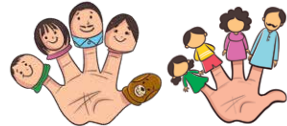
सरल औंला कठपुतली

आउनुहोस् अब हामी एक कदम अगाडि जाऔं र सरल औंला कठपुतली सिर्जना गरौं।