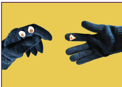
ଦସ୍ତାନା କଣ୍ଠେଇ କଥାବାର୍ତ୍ତା

ନିଜ ଇଚ୍ଛା ଅନୁସାରେ ଆଖି, ଜିଭ, କେଶ, ନାକ ଓ ଅନ୍ୟାନ୍ୟ ବୈଶିଷ୍ଟ୍ୟ ସାମିଲ କରନ୍ତୁ ।