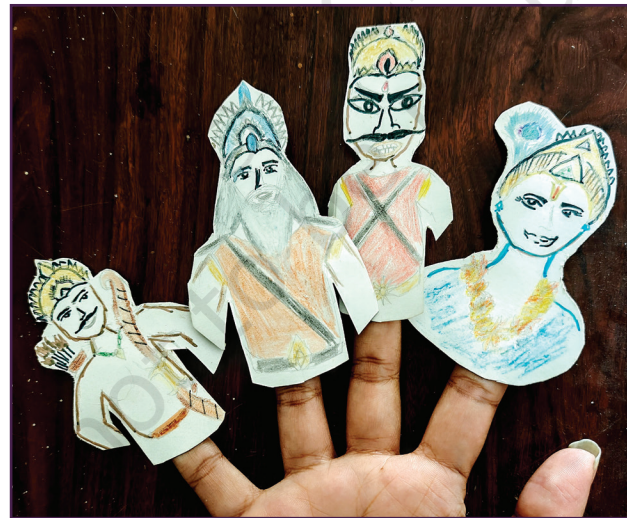
ପୁରାଣ ଓ ଇତିହାସର ଚରିତ୍ର