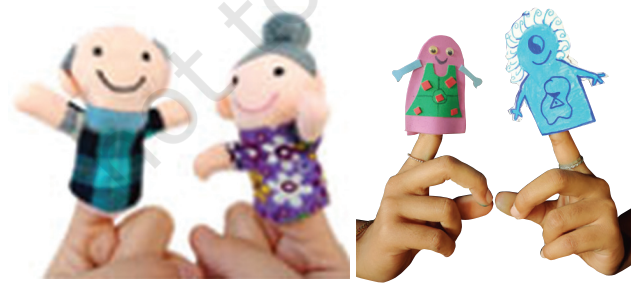
ଆଙ୍ଗୁଠି କଣ୍ଠେଇକ କଥାବାର୍ତ୍ତା