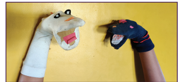
ମୋଜା କଣ୍ଠେଇ କଥାବାର୍ତ୍ତା

ଏହି ଶୋ'କୁ ତୁମ ଶ୍ରେଣୀରେ କିମ୍ବା ତୁମ ପରିବାରରେ ଉପସ୍ଥାପନ କର । ତୁମେ ଏବେ ଜଣେ କଣ୍ଠେଇ କଳାକର !