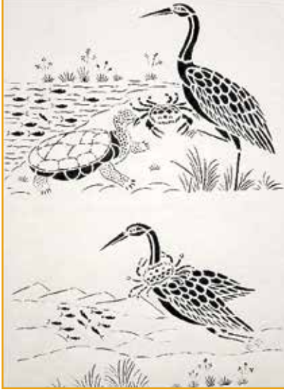
संझी पेपर कटिंग