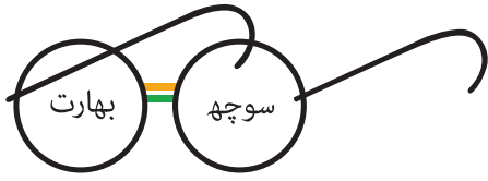
ایک قدم سوچھنا کی اور

”کیا آپ نے کرنسی نوٹ پر گول شیشوں والی عینک کی چھوٹی سی تصویر دیکھی ہے؟“