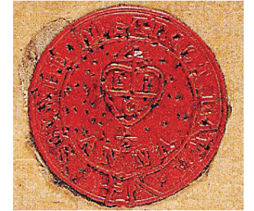
इतिहासाच्या विविध कालखंडातील मोहर