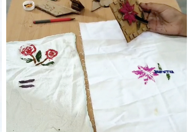
शिकके बनवून छापण्याचा विद्यार्थ्यांचा प्रयोग