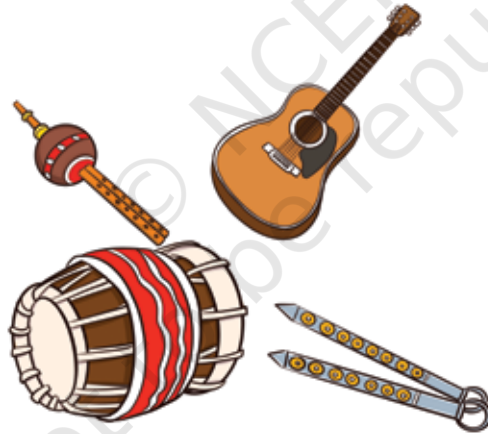
തവിൽ, പൂങ്കി, ചിന്ത, ഗിറ്റാർ മുതലായവയുടെ അകമ്പടിയോടെ ഒരു ഗാനം ആലപിക്കാം.