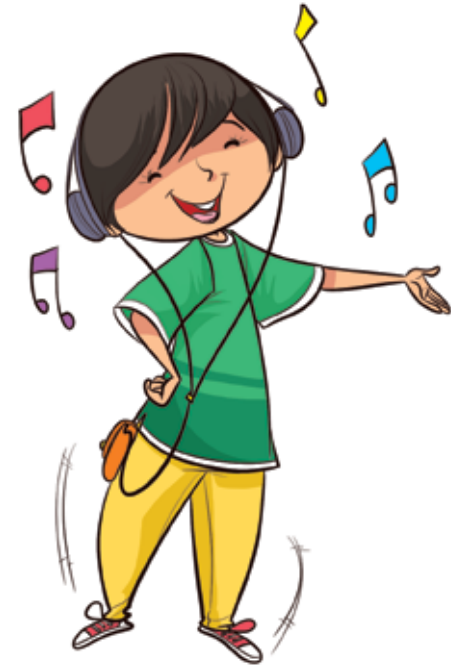
കരോക്കെ ഉപയോഗിച്ച് ഏത് മെഡ്ഡിയും പാടാൻ പഠിക്കുക

മെഡ്ഡി അല്ലെങ്കിൽ അതിലുള്ള ചില പാട്ടുകൾ പഠിക്കുക. ഓരോ ഗ്രൂപ്പും മെഡ്ഡിയുടെ ഒരു ഭാഗം അവതരിപ്പിക്കുന്ന രീതിയിൽ ക്ലാസിനെ ഗ്രൂപ്പുകളായി തിരിക്കാം. ഇന്ത്യയുടെ വിവിധ ഭാഗങ്ങളിൽ നിന്നുള്ള ആഘോഷ ഗാനങ്ങളുടെ ഒരു ശൃംഖലയാണ് ഈ മിശ്രിതം. ഈ രസകരമായ ഗാനങ്ങൾ ആലപിക്കുമ്പോൾ നീങ്ങളും , ചലിപ്പിക്കുകയും താളം നിലനിർത്തുകയും ചെയ്യുക !