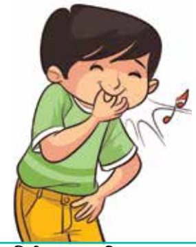
सिट्टी बजाउनु (हिसल)