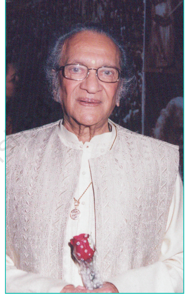
पंडित रविशंकर (भारतरत्न पुरस्कारविजेते)

वाद्ये समृद्ध संगीतानुभव निर्माण करतात. उपकरणांची उपयुक्तता आणि ज्या साहित्याने त्यांची निर्मिती केली जाते त्यानुसार त्यांचे वर्गीकरण करता येते. तुम्हाला आवडणारी गाणी ऐका. वापरली जाणारी साधने ओळखा आणि त्यांचे विविध श्रेणींमध्ये वर्गीकरण करा.