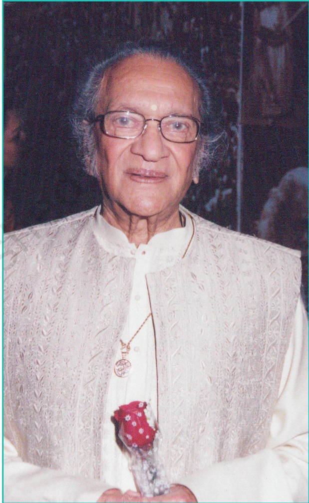
ପଣ୍ଡିତ ରବିଶଙ୍କର (ଭାରତ ରତ୍ନ ପୁରସ୍କାର ପ୍ରାପ୍ତ)

ବାଦ୍ୟଯନ୍ତ୍ର ଏକ ସମୃଦ୍ଧ ସଙ୍ଗୀତ ଅନୁଭୂତି ସୃଷ୍ଟି କରିଥାଏ । ଉପକରଣଗୁଡ଼ିକର ଉପଯୋଗିତା ଏବଂ ସେଗୁଡ଼ିକ ଯେଉଁ ପଦାର୍ଥରୁ ସୃଷ୍ଟି କରାଯାଏ ତାହା ଉପରେ ଆଧାର କରି ବର୍ଗୀକରଣ କରାଯାଇପାରେ । ତୁମେ ଉପଭୋଗ କରୁଥିବା ଗୀତଗୁଡ଼ିକ ଶୁଣ । ବ୍ୟବହୃତ ଉପକରଣଗୁଡ଼ିକୁ ଚିହ୍ନଟ କର ଏବଂ ସେଗୁଡ଼ିକୁ ବିଭିନ୍ନ ବର୍ଗରେ ଶ୍ରେଣୀଭୁକ୍ତ କର ।