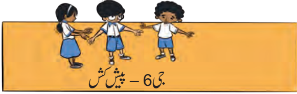
جی 6 - پیش کش