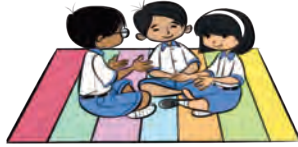
جی 2 - پروپریٹیز کا استعمال