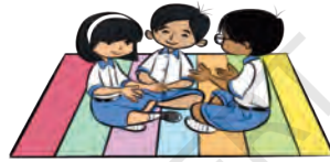
جی 1 - مکالمے