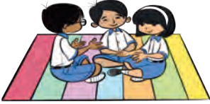
جی 3 - اداکاری