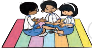
جی 5 - اسٹیج پر داخل ہونے اور باہر نکلنے کی جگہ