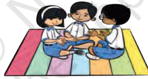
جی 4 - کہانی اور تسلسل کی وضاحت

آپ کی رائے: ہر پیش کش کے مثبت اور منفی دونوں پہلو ہوتے ہیں۔ ایمانداری سے اپنی رائے کا اظہار کیجیے کہ آپ کو پر فارمنس کیسی لگی۔ ہر شخص کی رائے مختلف ہو سکتی ہے اور یہ بالکل درست ہے۔ لیکن اپنی بات کہنے کے انداز میں احتیاط برتیں۔ مثبت پہلوؤں کو تعریف کے ساتھ بیان کریں اور منفی پہلوؤں کو ایسے انداز میں بتائیں جو اداکار کو تکلیف نہ پہنچائے بلکہ اگلی بار بہتر کرنے کی ترغیب دے۔ یہ دل چسپ مشغلہ آپ کے جائزہ لینے کی صلاحیتوں کو نکھارنے میں مدد دے گا۔