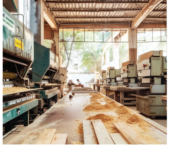
ଆସବାବପତ୍ର ଉତ୍ପାଦନ ଯୁନିଟ୍