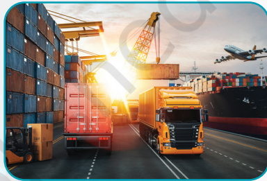
ବାଣିଜ୍ୟ ଏବଂ ଲାଜିଷ୍ଟ୍ରି