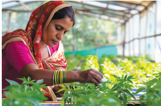
ଗ୍ରୀନ୍ ହାଉସ ଚାଷ

କୃଷି, ଖଣି ଖନନ, ମାଛ ଧରିବା, ପଶୁପାଳନ, ଜଙ୍ଗଲ ଇତ୍ୟାଦି ହେଉଛି ସବୁଠାରୁ ସାଧାରଣ ପ୍ରାଥମିକ କାର୍ଯ୍ୟ । ନିମ୍ନରେ ପ୍ରାଥମିକ କ୍ଷେତ୍ର ମଧ୍ୟରେ କେତେକ ପ୍ରକାରର କାର୍ଯ୍ୟକଳାପ ରହିଛି ।