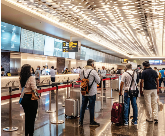
ବିମାନ ବନ୍ଦରରେ ସେବା