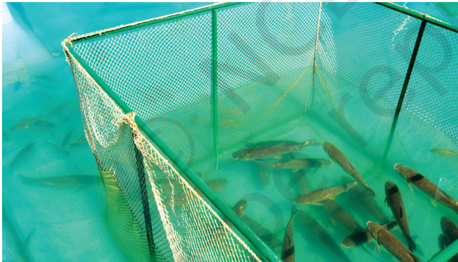
ମାଛ ଚାଷ (ମହ୍ୟ ଚାଷ)