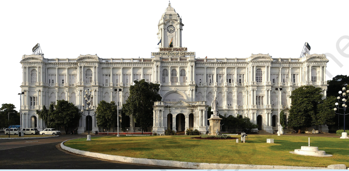
આકૃતિ ૧૨.૩. મદ્રાસ કોર્પોરેશન

મદ્રાસ કોર્પોરેશન (હવે ગ્રેટર ચેન્નાઈ કોર્પોરેશન)ની સ્થાપના 29 સપ્ટેમ્બર, 1688 ના રોજ થઈ હતી, જે ભારતની સૌથી જૂની મ્યુનિસિપલ સંસ્થા છે. ઇસ્ટ ઇન્ડિયા કંપનીએ ગયા વર્ષે એક ચાર્ટર બહાર પાડ્યું હતું, જેમાં 'ફોર્ટ સેન્ટ જ્યોર્જ' શહેર અને ફોર્ટથી 16 કિ.મી.ના અંતરે આવેલા તમામ પ્રદેશોને કોર્પોરેશનમાં સ્થાપિત કરવામાં આવ્યા હતા. ૧૭૯૨ના સંસદીય અધિનિયમથી મદ્રાસ કોર્પોરેશનને શહેરમાં મ્યુનિસિપલ ટેક્સ લાદવાની સત્તા આપવામાં આવી હતી, ત્યારથી જ મ્યુનિસિપલ વહીવટની શરૂઆત યોગ્ય રીતે થઈ હતી.