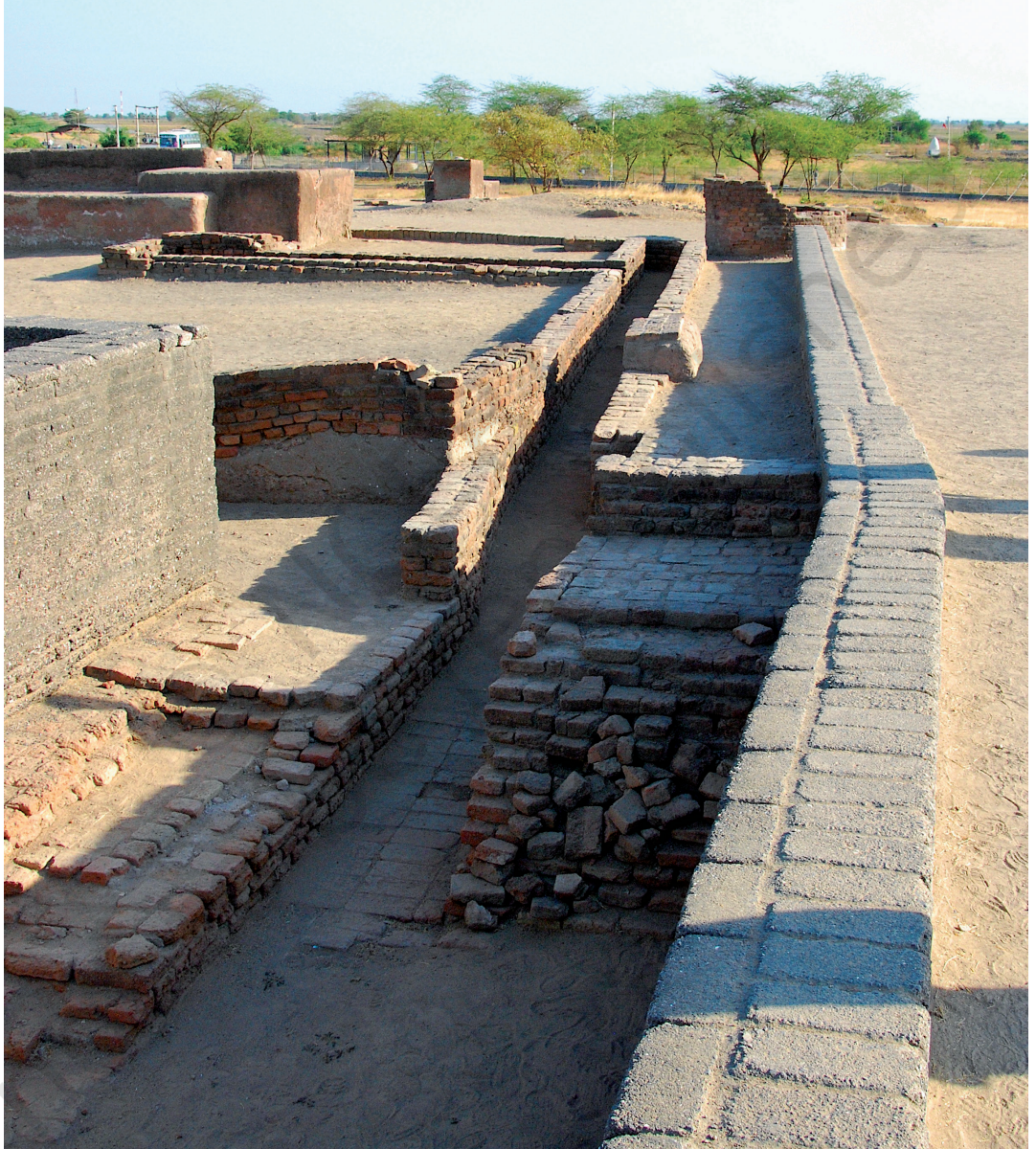
شکل 6.7۔ لوتھل (گجرات) منز ڈرینیج سسٹم

بڑیو دیت آبک انتظام تہ صفائی واریاہ اہمیت۔ تمن آس اکثر پننن گھرن منز سزان کرنہ خاطر الگ الگ جایہ آسان۔ یم آس نالن بندس اکس بڑس رآبتس سینی جڑتہ (تصویر 6.7)، یم عام طور پآٹھی سڑکن بون پکان آس تہ گند آب دور نوان۔