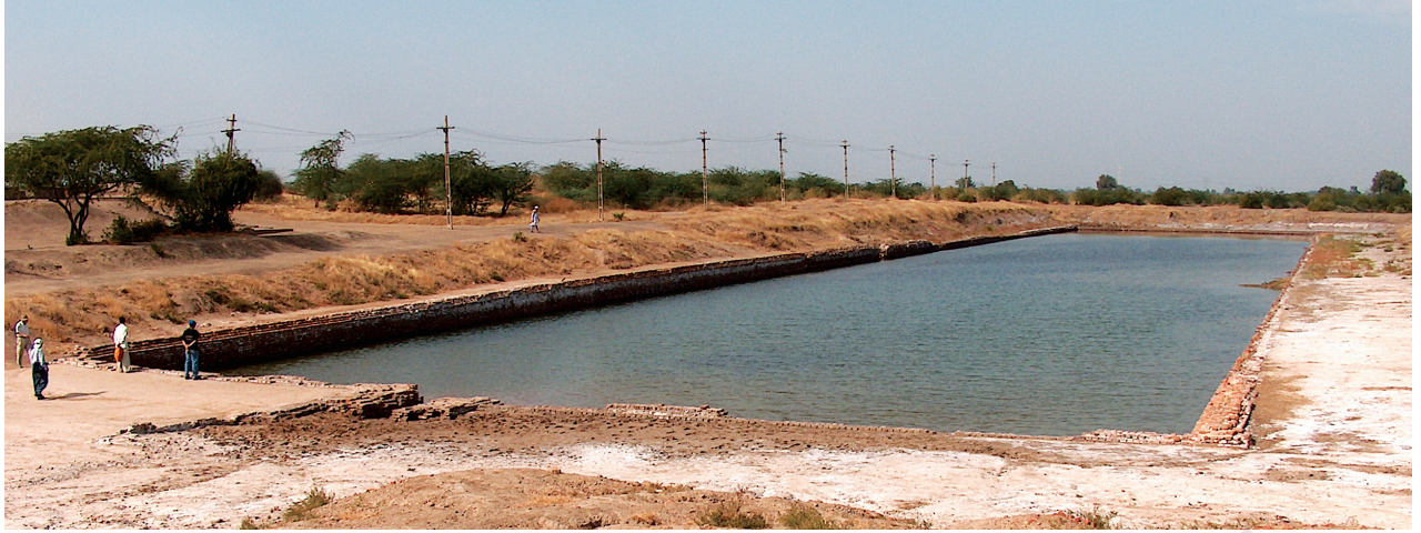
شکل 6.12۔ لوتھلس پیٹھ بوڑ ڈاک بارڈ

عام طور پائھی آس سٹیٹائٹس سیتو بناونہ یوان، اکھ نرم کنی یس گرم کرنہ سیتو سخت گڑھہ۔ تم چھ صرف کیئہہ سینٹی میٹر پیمائش کران تہ عام طور پائھی چھ جانورن ہنر شکلہ باوان، یمن پیٹھ، کیئہہ علامات چھ یم تحریری نظامک حصہ چھ۔ مگر یہ نظام تہ جانورن ہنر اعداد و شمارک علامتی معنی چھ وئیک تام سمجھنہ یوان۔ یہ چھ یقینی ز تم چھ کنہ تہ طریقہ تجارتی سرگرمین سیتو تعلق تہاوان۔