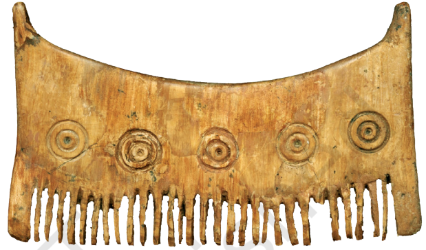
شکل 6.11۔ عمان کس بٹھس پیٹھ لینہ پنے والی بڑپا باتھی دنن بند کنگہ (تقریباً 7 سینٹی میٹر زیوٹہ)

یتہ تجارت کرنہ خاطر، کور تمو زمینی وتہ تہ دریاو، تہ سمندرس زیاد دور دراز منزلن خاطر استعمال۔ یہ چہ بندوستانس منز گوڈنچ شدید سمندری سرگرمی۔ درحقیقت، کیئہ بڑپا بستہ چہ گجرات تہ سندھ کین ساحلی علاقن منز واقعہ لوتھل، گجراتچ اکھ لوکٹ بستہ، چہ معاشرچ ایکسپلورنگ: بندوستان تہ ماضی کہ ٹیپیسٹری نیبر اکھ حیرت انگیز طور پاتھی چہ اکھ بوڑ بیسن یس 217 میٹر زیچہر تہ 36 میٹر کھجرک