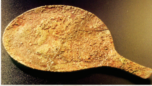
شکل 6.14-1 (ٹاپ)، 6.14-2 (دوچھن)۔ اکھ برونز میرر۔ اکھ ٹیراکوٹا پاٹ (دوشوے دھولا ویرا پیٹھ)