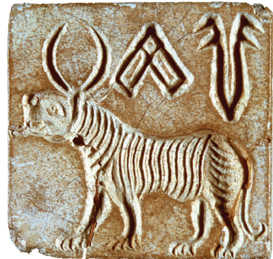
شکل 6.13-1، 6.13-2، 6.13-3۔ (کھوہر پیٹھ رچھن کن) بڑیا مہر یتھ منز اکھ یونیکارن باونہ چھ یوان۔ بڑیا مہر یتھ منز بیل باونہ آمت چھ۔ بڑیا مہر یتھ منز اکھ بینگہ وول سپہ باونہ آمت چھ