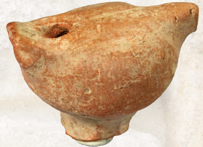
شکل 6.14-5، 6.14-6۔ اُکس کنہ پیٹھ کھنتھ اکھ گیم بورڈ، تقریباً 25 سینٹی میٹر زیچھر (دھولا ویرا پیٹھ): اکھ ٹیراکوٹا سیتی، تقریباً 4 سینٹی میٹر زیچھر (راجستھان کس کرن پورہ پیٹھ)۔ بڑپاں بناؤ واریاہ کھیل تہ تماشہ دوشوے بالغ تہ شرے !خوش تھونہ خاطر