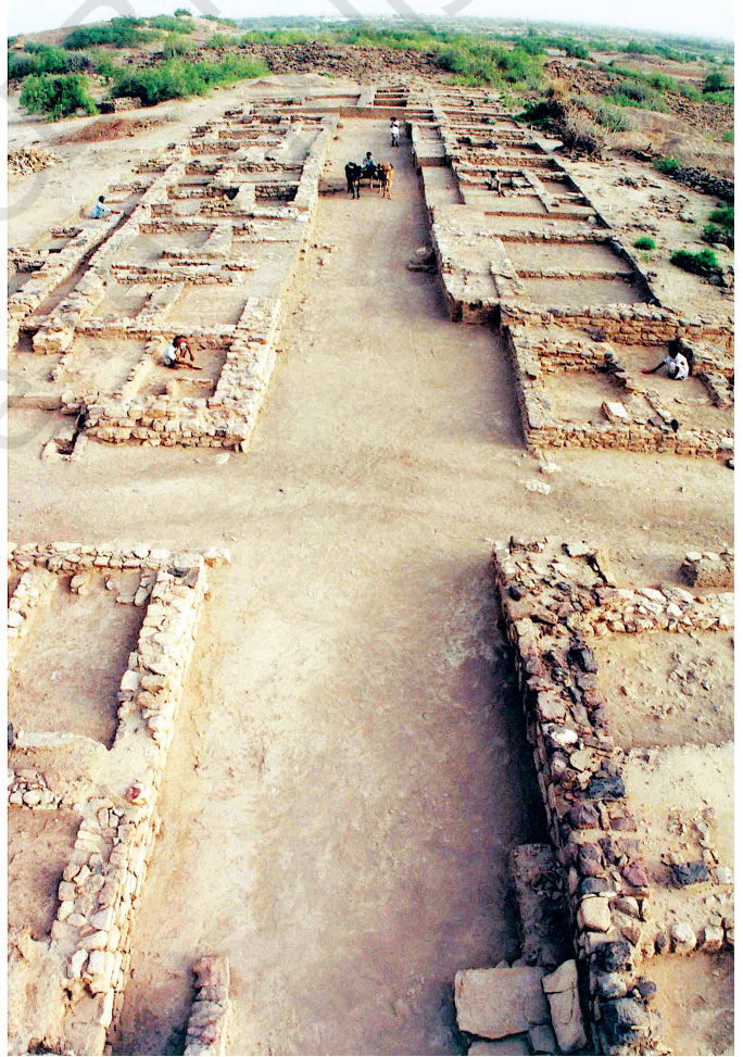
دوچہن (شکل 6.5۔ دھولا ویرابھس) میں مکان بننے علاقہ، کھڑس سڑک سیتی، درمیانی قصبہ میں (دھولا ویرابھس میں آس تڑے الگ الگ علاقہ، نہ کہ باقی شہر بننے پاٹھی)۔ امہ علاوہ، اتھ شہر میں زیادہ تر عمارتیں بننے بنیا آس کنیو سیتی بناونہ آمڑ۔