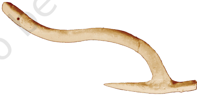
(شکل 6.9۔ بلک اکھ لوکٹ میژ بندا ماؤل (بریانہ کس بناولی پیٹھ)

بڑپاہن بناو پننی واریاہ ہستی بڑین یا لوکٹین ڈریاؤن ہندس ہٹھس ستر۔ یہ چھ اکھ منطقی انتخاب، نہ صرف آہس تام آسان رسائی خاطر، بلکہ زمین داری خاطر تہ، تکیاز ڈریاو چھ پننس آندی پکھو میژ بڑاوان۔ آثار قدیمہ کیو نتانجن ستر چھ پتہ پکان ز بڑپا آسہ دالہ تہ مختلف قسیمچہ سبزی علاو جو، گنک، کینہہ باجرا تہ کٹھ ساتھ توئل ووپداوان۔ تم آسہ یوریشیانس منز کپاس ووپداون والی گوڈنکی تہ، یس تم پلو وونان آسہ۔ تمو بناو کاشتکاری بند اوزار، بشمول بل (تصویر 6.9)، یمو منز چھ جدید دورس استعمال کران۔