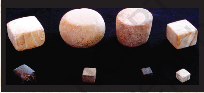
شکل 6.14-3 (ٹاپ)، 6.14-4 (دوچھن)۔ کنن بند کیشہ وزن۔ اکھ کانسی ہنز (چھنی) (دوشوے دھولا ویرا بست)