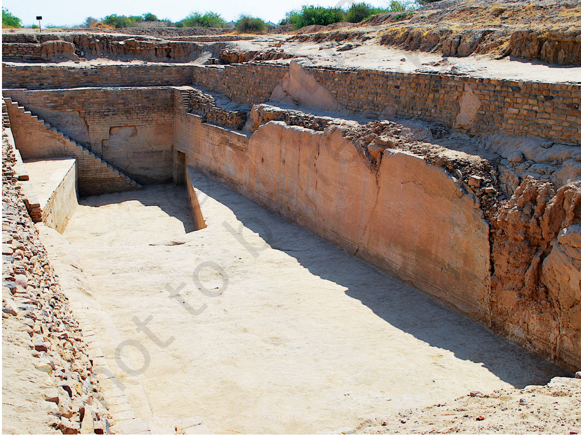
فیگ 6.8۔ دھولاویرا بس منز چھ کنہ منز اکھ بوڑ ذخیر ژٹنہ آمت، ییمیک زیچھر 33 میٹر چھ

- دھولاویرا بس منز آسی کم کھوتہ کم شے بڑو ذخائر کنیو سیتی بناونہ آمتی یا کنہ منز تہ ژٹنہ آمتی (تصویر 6.8)۔ یمو منز آسی زیاد تر آب جمع کرنہ تہ تقسیم کرنہ خاطر زیر زمین نالن ہند ذریعہ رلنہ۔