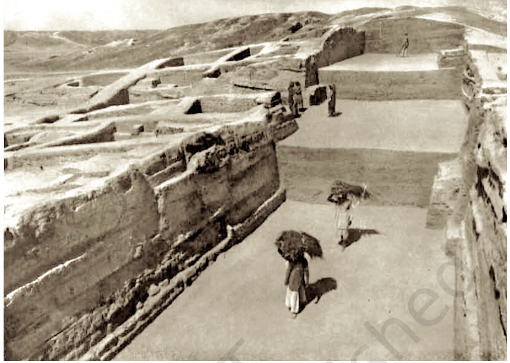
شکل 6.4۔ بونیس قصبہ (ٹاپ) کس علاقہ میں کالی بنگن (راجستھان) میں اکہ وسیع سڑک