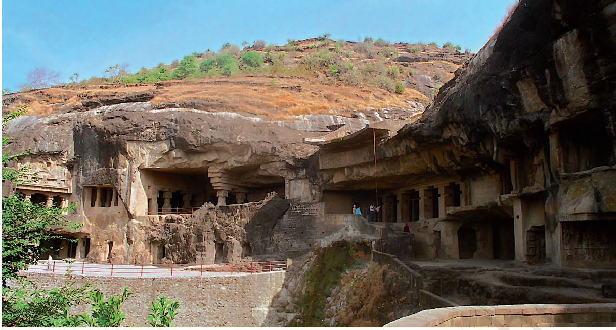
6मीं ते 10मीं सदी ईस्वी दे बिच बौद्ध एलोरा (महाराष्ट्र) च गुफाएं दा निर्माण कीता गेआ हा। इं'दे चा किश गुफां हिंदू दर्शन थमां न, जद् के होर बौद्ध ते जैन धर्म दियां न।