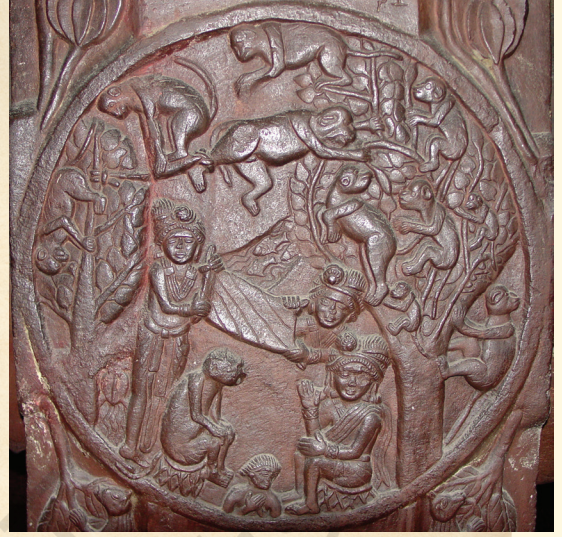
बंदर - राजा दी कहानी गी दर्शाने आहू ला इक पत्थर दा पैनल ( मध्य प्रदेश दे भरहुत च )

लेई जाया गेआ । राजा एहूदे स्वाद शा इन्ना मुग्ध होई गेआ जे उन्नै अपने सैनिकें गी उस बूहूटे दा पता लाने दा हुकम दिता जेहूड़ा ओहू आया हा । लम्मी तपाश दे परैत्त, उ'नें गी बूहूटा मिलेआ - ते बंदर बूहूटे दे फलें दा नंद लैदे हे । सैनिकें बंदरें पर हमला कीता । बंदर-राजा आस्तै अपने बंदरें गी बचाने दा इकमात्तर तरीका उ'नें गी धारा पार करने च मदद करना हा, पर ओहू आपूं नेहा नेई करी सके । उ'दे कोला बड़ा बड्डा होने दे कारण, बंदर - राजा ने दुए कंठे पर इक बूहूटे गी फड़ी लैता ते उ'नें गी धारा पार करने आस्तै अपने शरीर दा इस्तेमाल इक पुल दे रूपा च करने दिता, हालां-के इस प्रक्रिया च उ'नें गी गंभीर चोट लगगी ही ते आखरकार उ'दी मौत होई गेई ।