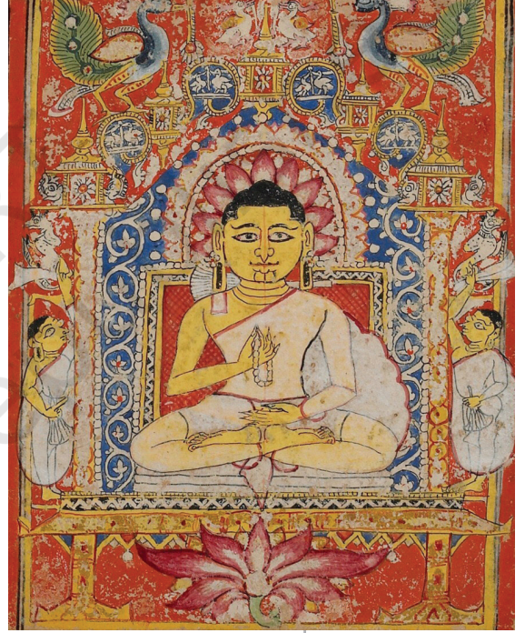
महावीर दी इक पारंपरिक चित्तर

जैन धर्म इक होर म्हत्ता आहू ली विचारधारा ऐ जेहू डी उसै समें दरान लोकप्रिय होई, हालां-के एहूदियां जड़ां मतियां परानियां मन्नियां जंदिंयां न। सिद्धार्थ गौतम आंहगर, राजकमार वर्धमान दा जनम ईसा पूर्व छेमीं सदी दी शुरुआत च इक शाही परोआर च होआ हा। उ'दा जनम-थाहू र आधुनक बिहार च वैशाली शैहू र दे कोल हा। 30एं बरें दी उमरी च, उ'नें अपना घर छोड़ने ते अध्यात्मक ग्यान दी तपाश च जाने दा फैसला कीता। उ'नें अपने सन्यास दे दरान इक अनुशान भरोचे तपस्वी जीवन दा पालन कीता ते कठोर साधना दे 12एं ब'रें परैत्त उ'नेंगी 'अनंत ग्यान' गी हासल कीता। उ'नें गी 'महावीर' जां 'महान नायक' दे रूपै च जानेआ जान लगा, ते उ'नें अपने अर्जित ग्यान दा उपदेशें राहें प्रचार शुरु करी दिक्ता ।