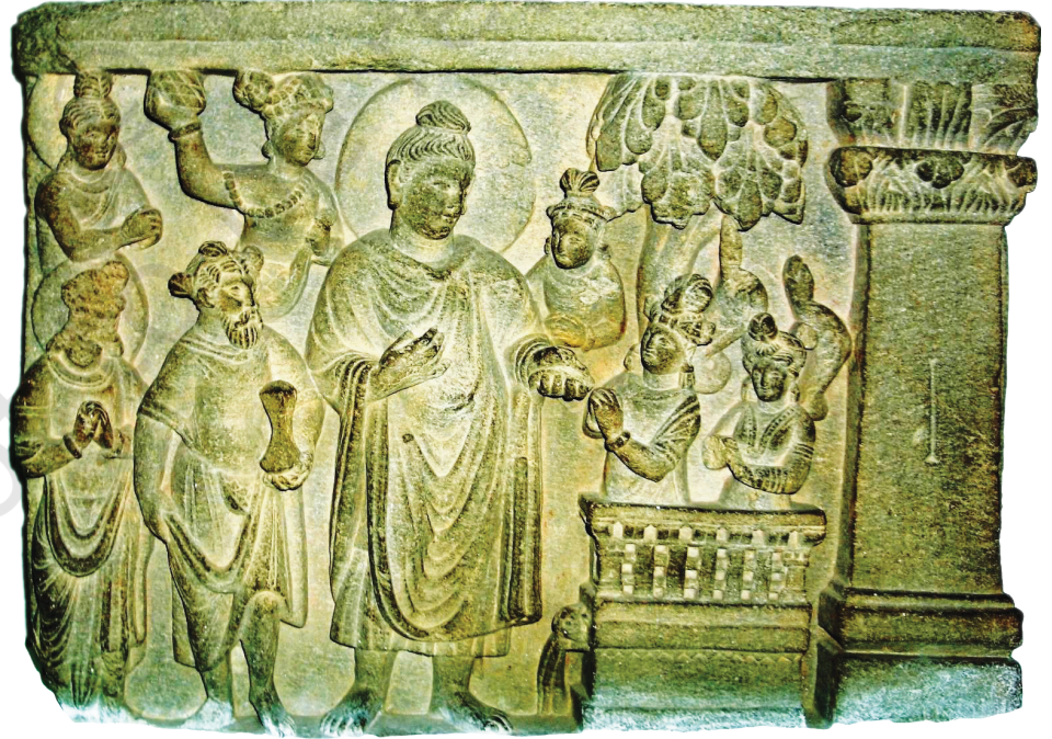
तकरीबन 1, 800 बरे पराना एहू पत्थर पैल बुद्ध दी शिक्षा गी दर्शादा ऐ।