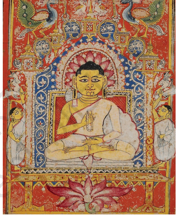
મહાવીર વર્ધમાનનું એક પરંપરાગત ચિત્ર

જૈન ધર્મ જૈન ધર્મ એ એક અન્ય મહત્વપૂર્ણ દર્શન છે જે તે જ સમયે લોકપ્રિય બન્યું, જોકે તેને વધુ પ્રાચીન માનવામાં આવે છે. સિદ્ધાર્થ ગૌતમની જેમ, રાજકુમાર વર્ધમાનનો જન્મ પણ છઠ્ઠી સદી બીસીઈમાં થયો હતો. શરૂઆતમાં તે વૈશાલી શહેર (હાલમાં બિહારમાં) નજીક બન્યું હતું. તેમણે ૩૦ વર્ષની ઉંમરે પોતાનું ઘર છોડીને આધ્યાત્મિક જ્ઞાનની શોધ કરવાનું નક્કી કર્યું. તેમણે તપસ્વી જીવનના શિસ્તનું પાલન કર્યું અને ૧૨ વર્ષ પછી, તેમણે 'અનંત' જ્ઞાન અથવા પરમ શાણપણ પ્રાપ્ત કર્યું. તેઓ 'મહાવીર' અથવા 'મહાનાયક' તરીકે જાણીતા થયા અને તેમણે પોતાના પ્રાપ્ત જ્ઞાનનો પ્રચાર કરવાનું શરૂ કર્યું.