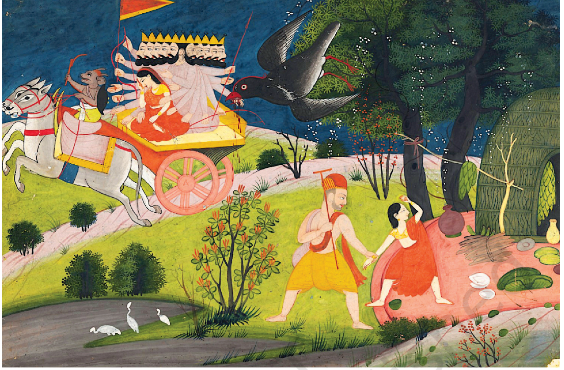
चित्रम् ८.६. रामायणस्य (१८ शताब्दी, हिमाचलप्रदेशः) एकस्य प्रमुखप्रकरणस्य चित्रम् ।