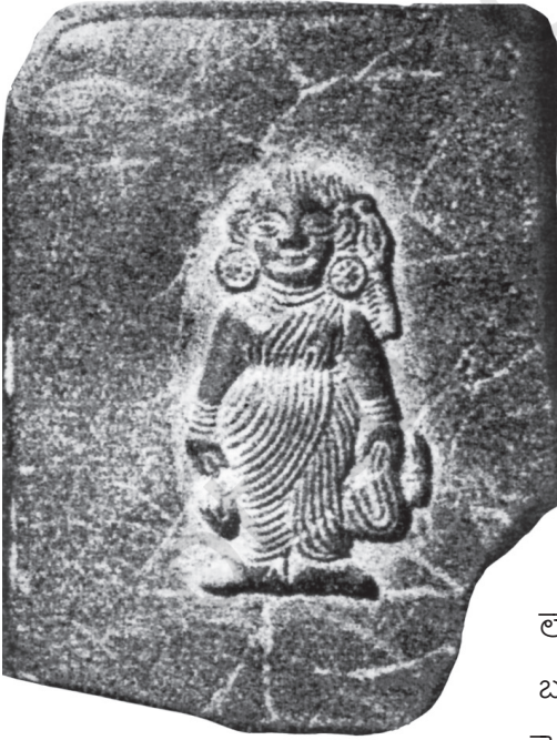
పటం 8.2. రాతి ఉపశమనం వైశాలికి చెందిన చీరలో మహిళ (నేడు బీహార్ లో)

సామాజిక అన్వేషణ: భారతదేశం మరియు వెలుపల మన సాంస్కృతిక వారసత్వం మరియు జ్ఞాన సంప్రదాయాలు