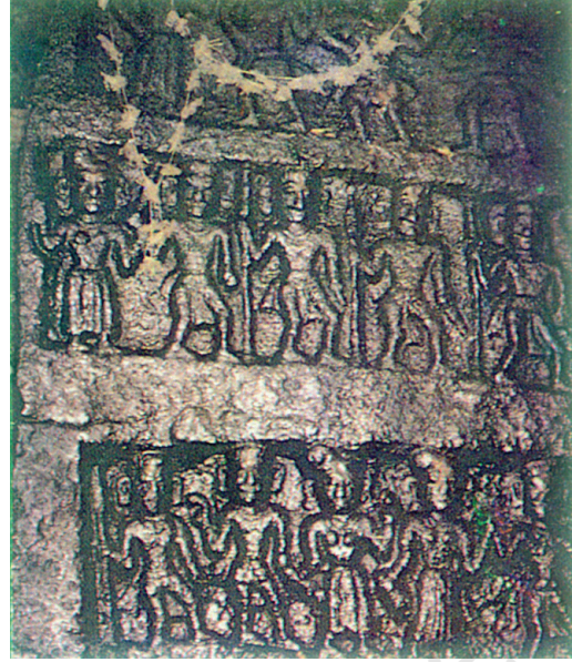
పటం 8.7. 'పచ్చా పాంపర్', తమిళనాడులోని నీలగిరి అడవిలో చెక్కిన రాయి, ఇది ఐదుగురు పాణవ సోదరులను వర్ణిస్తుంది. ఈ రాయి ఉన్న మందిరాన్ని పాండవులు ప్రయాణించినందుకు గుర్తుగా ఇరుల గిరిజనులు నిర్వహిస్తారు. tఆయన ప్రాంతం.

ఈశాన్య మరియు హిమాలయ ప్రాంతాలలోని చాలా తెగలు రెండు ఇతిహాసాలలో ఏదో ఒకదానికి లేదా రెండింటికి వారి స్వంత వెర్షన్ ను కలిగి ఉన్నాయి. ఈ గిరిజన అనుసరణలు మౌఖికంగా ప్రసారం చేయబడతాయి, రామాయణం మరియు మహాభారతం యొక్క వీరులు (సాధారణంగా ఐదుగురు పాణవులలో ఎవరైనా లేదా అందరూ, వారి భార్య ద్రౌపది, కానీ కొన్నిసార్లు వారి బంధువు మరియు విరోధి దుర్యోధనుడు కూడా) ఆయా తెగల ప్రాంతాలను ఎలా సందర్శించారు అనే పురాణాలతో పాటు.