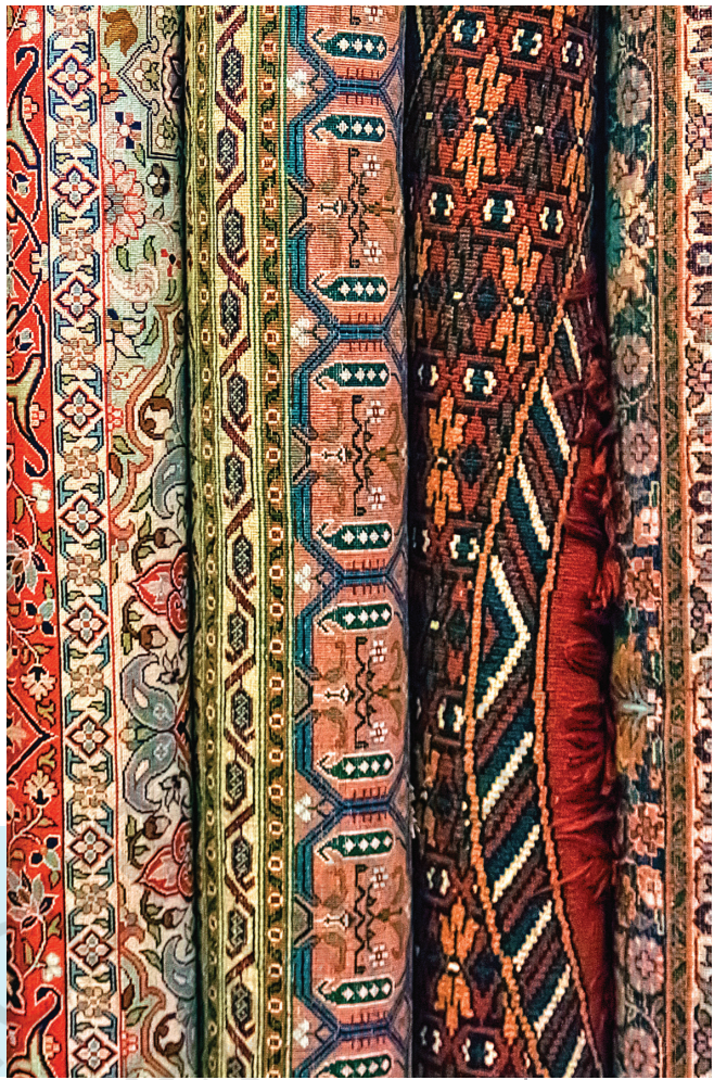
పటం 8.3. రంగురంగుల సాంప్రదాయ భారతీయ వస్త్రాల యొక్క కొన్ని నమూనాలు.

చీర యొక్క ఉదాహరణ ఏకత్వం మరియు వైవిధ్యం రెండింటినీ ఎలా ప్రతిబింబిస్తుందో (100-150 పదాలలో) వివరించండి.