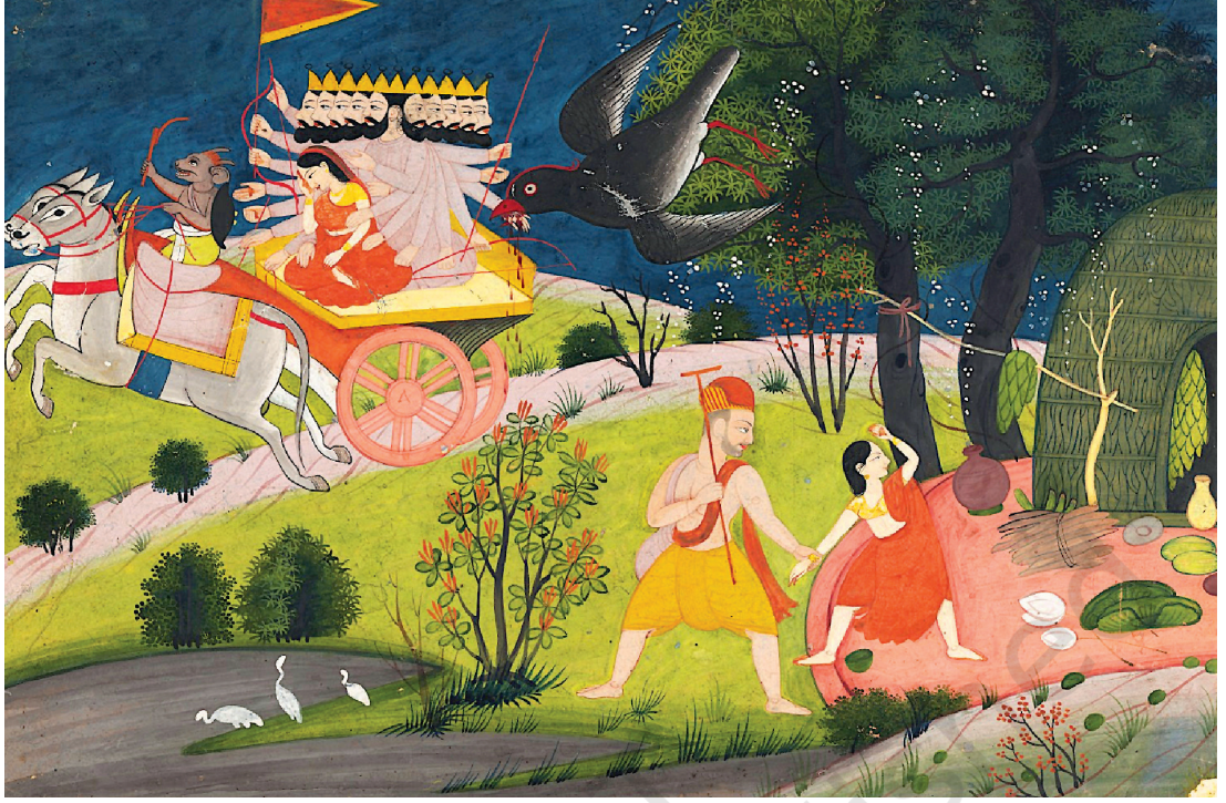
चित्र 8.6 रामयण (18वीं शताब्दी, हिमाचल प्रदेश) की एक प्रमुख कड़ी गी दर्शाने आहली एक पेंटिंग।