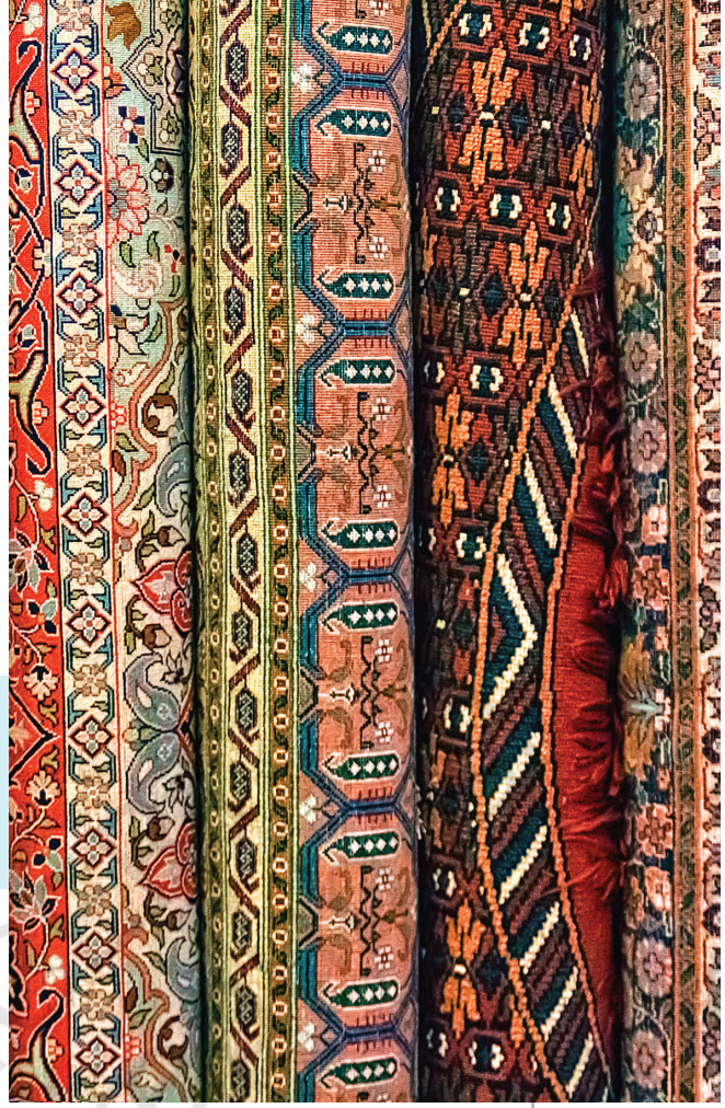
चित्र 8.3। रंगीन पारंपरिक भारती टल्लें दे किश नमूने।

समझाओ जे साड़ी दी मसाल एकता ते बन्न-सबन्नता दौनें गी कि'यां दर्शादी ऐ (100 - 150 शब्दें च)