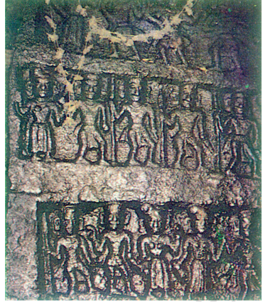
चित्र 8.7। ‘पचा पाताल वाद’, तमिलनाडु दे नीलगिरी दे जंगलै च इक नक्काशीदार बन्न, जेहू इा पं’जे पाहूडे भाएं गी दर्शादा ऐ। इस पत्थर आहू ले मंदर दा रक्ख-रखास इरुला आदिवासियें आसेआ पाशवें दे लंघने दे चेते च कीता जंदा ऐ। ओहू खेतर।

अखीर च, असेंगी चेता रक्खना चाहिदा जे भारती संस्कृति बन्न-सबन्नता गी इक संवर्धन दे रूपै च मनादी ऐ, पर उस अंतर्निहित एकता गी कदें नेई भुल्लदी जेहू डी उस बन्न-सबन्नता गी पोशन दिंदी ऐ।