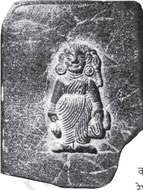
चित्र 8.2। एकटा पाथरक राहत वैशाली (आइ बिहारमे) सं साड़ी पहिरने महिला

भारतक प्रत्येक क्षेत्र आ समुदाय वस्त्र आ परिधानक अपन शैली विकसित कयलक अछि। तइयो किछु पारम्परिक भारतीय परिधान मे समानता देखैत छी, चाहे उपयोग कयल गेल सामग्री कोनो हो। एकटा स्पष्ट उदाहरण वस्त्रक सादा लम्बाई छैक जकरा साड़ी कहल जाइत छैक, जे भारतक अधिकांश भागमे पहिरल जायवला एकटा प्रकारक वस्त्र छैक आ अलग-अलग वस्त्रसँ बनाओल जाइत छैक - अधिकांशतः सूती या रेशम, मुदा आइ-काल्हि कृत्रिम वस्त्र सेहो। बनारसी, कांजीवरम, पैठनी, पाटन पटोला, मुगा वा मैसूर रेशमक किछु प्रसिद्ध प्रकारक साड़ी अछि। कतेको आओर प्रकारक सूती साड़ी अछि। कुल मिला कऽ ई वस्त्रक बिना सिलाएल टुकड़ा सैकड़ो किस्ममे अबैत अछि। ई बुनाई (दहिना दिस चित्र 8.3) आ डिजाइनिंगक