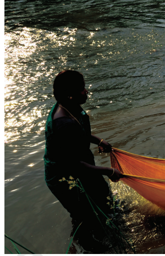
चित्र 8.4। महिला अक्सर कतेको लोकक लेल साड़ी लगाउ एकरा सं परे उपयोग करैत अछि पोशाक (चित्र दक्षिण भारत सँ)।