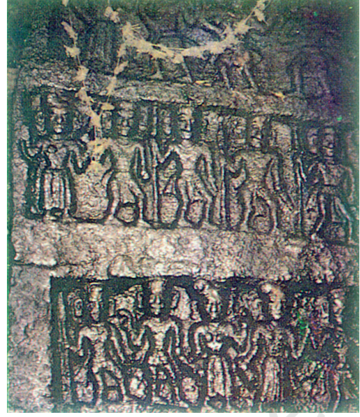
चित्र 8.71 'पाँच पाण्डव', तमिलनाडुक नीलगिरीक जंगलमे एकटा नक्काशीदार पाथर, जाहिमे पाँच पाण्डव भाइक चित्रण अछि। एहि पाथरवला मन्दिरक रखरखाव इरुला आदिवासी लोकनि द्वारा पाण्डवक गुजरबाक स्मरणमे कयल जाइत अछि। †ओ क्षेत्र।

सहित भारतक पूर्वोत्तर आ हिमालयी क्षेत्रक अधिकांश जनजातिक दुनू महाकाव्यमेसँ कोनो न कोनो वा दुनूक अपन संस्करण रहल अछि। ई जनजातीय रूपांतरण मौखिक रूपसँ प्रसारित कयल जाइत अछि, संगहि एहि बातक किंवदन्तीक सङ्ग जे कोना रामयान आ महाभारतक नायक (सामान्यतः पाँचो पाण्डवमे सँ कोनो वा सभ, हुनक पत्नी द्रौपदी, मुदा कखनो काल हुनक पितियौत बहिन आ विरोधी दुर्योधन) जनजातिक सम्बन्धित क्षेत्रक भ्रमण कयलनि।