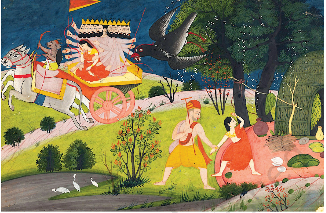
चित्र 8.6। रामयानक एकटा प्रमुख प्रकरणक चित्रण करयवला एकटा चित्र (18 थ शताब्दी, हिमाचल प्रदेश)