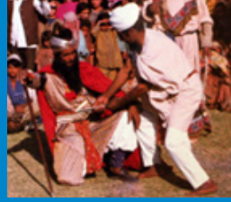
बंद पाथेर, काश्मीर