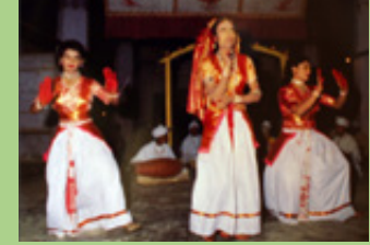
अंकिया नाट, आसाम