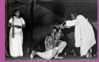
जाला, अस्तंत बंगाल