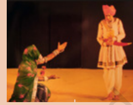
माच, मध्य प्रदेश