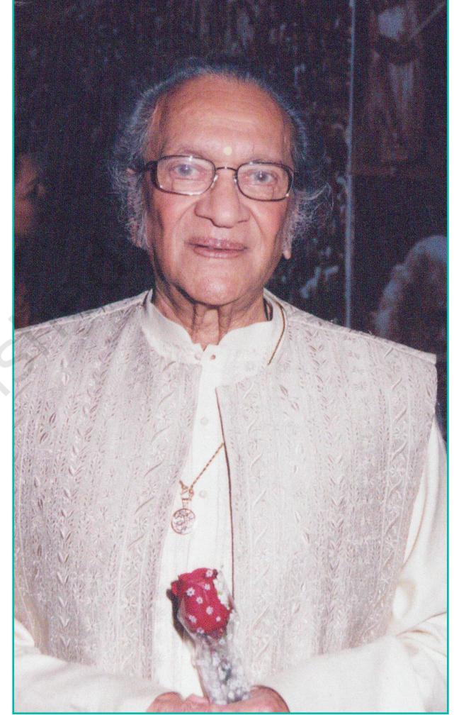
પંડિત રવિશંકર (ભારત રત્નથી સન્માનિત)

વાદ્યો સંગીતનો સમૃદ્ધ અનુભવ બનાવે છે. ઉપકરણોને તેમની ઉપયોગિતા અને તે જે સામગ્રીથી બનાવવામાં આવે છે તેના આધારે વર્ગીકૃત કરી શકાય છે. તમને જે ગીતોનો આનંદ આવે છે તે સાંભળો. ઉપયોગમાં લેવાયેલા ઉપકરણોને ઓળખો અને તેમને વિવિધ કેટેગરીમાં વર્ગીકૃત કરો.