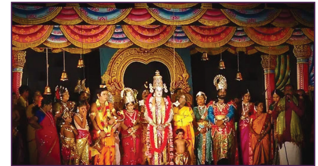
ಸುರಭಿ ನಾಟಕಗಳು ಮ್ಯಾಜಿಕ್, ಲೈವ್ ವಿಎಫ್‌ಎಕ್ಸ್ ಮತ್ತು ತರ್ಕವನ್ನು ರಂಗದ ಮೇಲೆ ಧಿಕ್ಕರಿಸುವ ಸಾಹಸಗಳನ್ನು ಬಳಸುವುದರಲ್ಲಿ ಹೆಸರುವಾಸಿಯಾಗಿವೆ

ಸುರಭಿ ರಂಗಭೂಮಿ ಅಥವಾ ಶ್ರೀ ವೆಂಕಟೇಶ್ವರ ನಾಟ್ಯ ಮಂಡಳಿ ೧೮೮೫ರಲ್ಲಿ ಆಂಧ್ರಪ್ರದೇಶದಲ್ಲಿ ರೂಪುಗೊಂಡಿತು. ಅದರ ಮೊದಲ ನಾಟಕವು ಕೀಚಕ ವಧೆಯಾಗಿತ್ತು. ಇದು ಹಿಂದೂ ಸಂಪ್ರದಾಯ ಮತ್ತು ಇತಿಹಾಸವನ್ನು ಆಧರಿಸಿದ ಕಥೆಗಳನ್ನು ಪ್ರದರ್ಶಿಸುವ ಕುಟುಂಬ ನಾಟಕ ಕಂಪನಿಯಾಗಿದೆ. ೧೯೮ ವರ್ಷಗಳಿಂದ ಉಳಿದುಕೊಂಡಿರುವ ಕೆಲವೇ ತಂಡಗಳಲ್ಲಿ ಇದು ಒಂದಾಗಿದೆ. ಸುರಭಿ ರಂಗಮಂದಿರವು