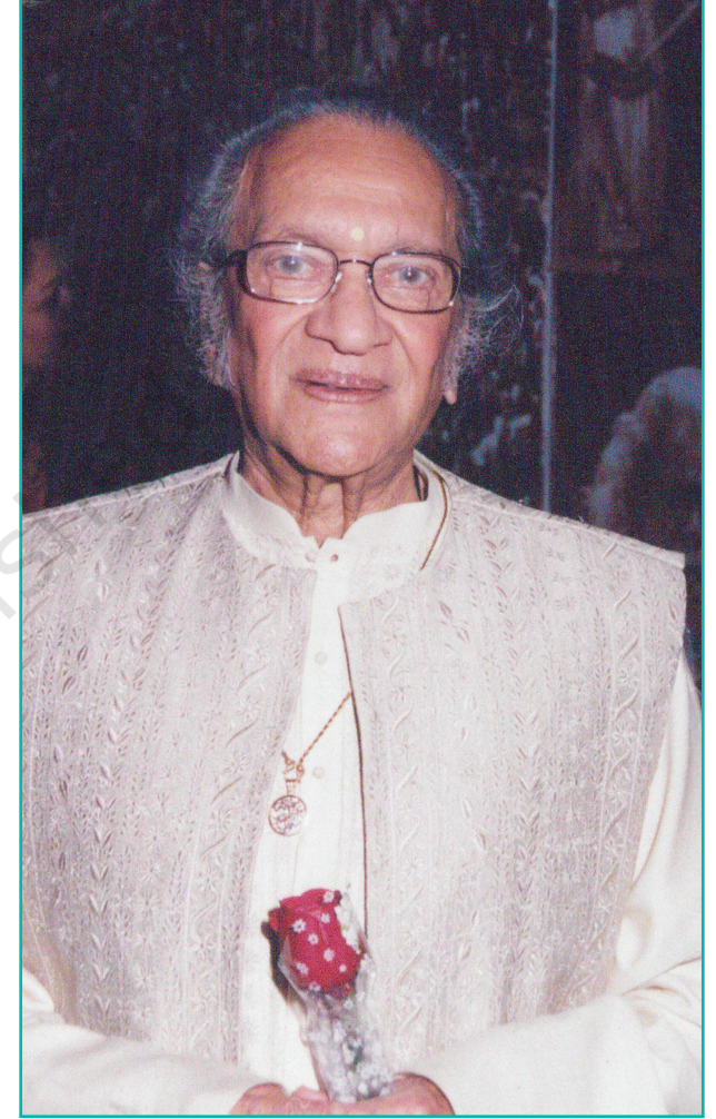
ಪಂಡಿತ್ ರವಿಶಂಕರ್ (ಭಾರತ ರತ್ನ ಪ್ರಶಸ್ತಿ ಪುರಸ್ಕೃತ)

ವಾದ್ಯಗಳು ಶ್ರೀಮಂತ ಸಂಗೀತ ಅನುಭವವನ್ನು ಸೃಷ್ಟಿಸುತ್ತವೆ. ವಾದ್ಯಗಳನ್ನು ಅವುಗಳ ಉಪಯುಕ್ತತೆ ಮತ್ತು ಅವುಗಳನ್ನು ರಚಿಸಿದ ವಸ್ತುವಿನ ಆಧಾರದ ಮೇಲೆ ವರ್ಗೀಕರಿಸಬಹುದು. ನೀವು ಆನಂದಿಸುವ ಹಾಡುಗಳನ್ನು ಕೇಳಿ. ಬಳಸುವ ಉಪಕರಣಗಳನ್ನು ಗುರುತಿಸಿ ಮತ್ತು ಅವುಗಳನ್ನು ವಿವಿಧ ವರ್ಗಗಳಾಗಿ ವರ್ಗೀಕರಿಸಿ.