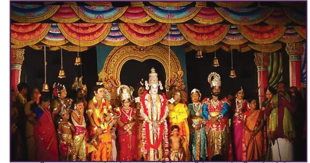
சுரபி நாடக நாடகங்கள் மேடையில் மேஜிக், லைவ் விஃபிள்க்ஸ் மற்றும் தர்க்கத்தை மீறும் சாதனைகளைப் பயன்படுத்துவதற்கு பெயர் பெற்றவை