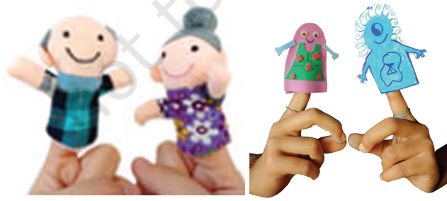
விரல் பொம்மை உரையாடல்