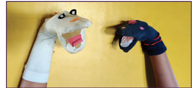
சாக் பொம்மலாட்ட உரையாடல்

இந்த நிகழ்ச்சியை உங்கள் வகுப்பில் அல்லது உங்கள் குடும்பத்தினருக்கு வழங்கவும். இனி நீ ஒரு பொம்மலாட்டக் கலைஞன்!