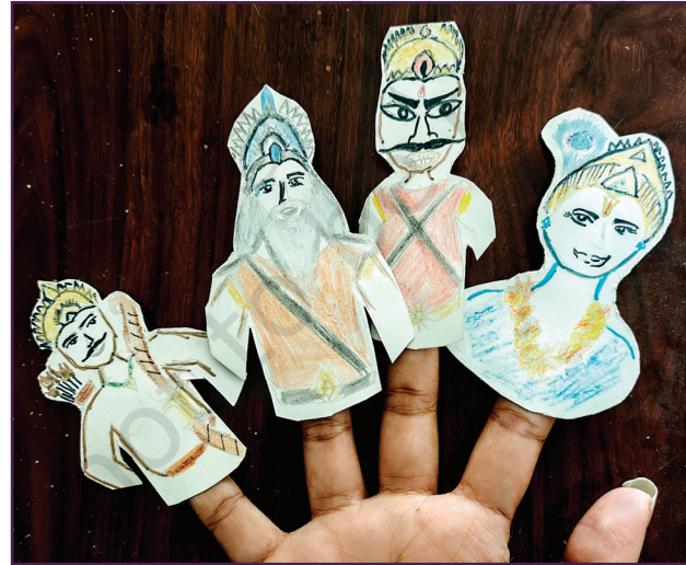
புராணம் மற்றும் இதிகாசத்தின் கதாபாத்திரங்கள்