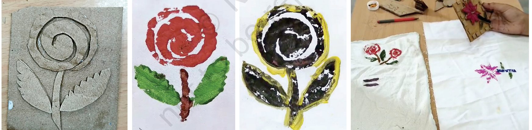
மாணவர்கள் முத்திரைகள் தயாரித்து அவற்றை அச்சிடுவதில் பரிசோதனை செய்யுங்கள்