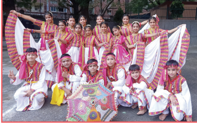
गरबा नचण गुजरात जो