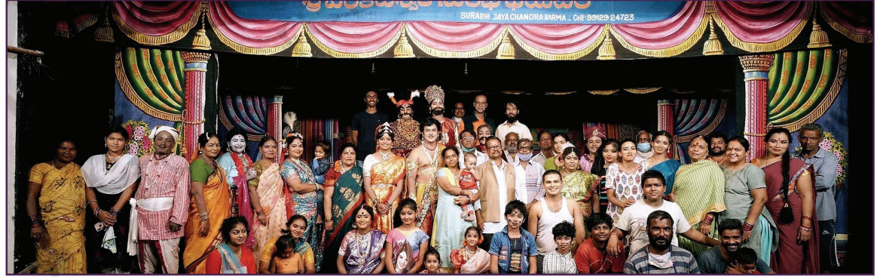
हिक शो खा पो कंपनी थिएटर टीम