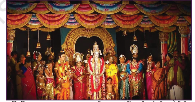
सुरभि थिएटर जा नाटक जादू, लाइव वीएफएक्स' ऐंमंच ते तर्क खे चुनौती देण वारे करतबों जे इस्तेमाल जे लाय जान या वेन्दा हुआ

सुरभि थिएटर या श्री वेंकटेश्वर नाट्य मंडली जी स्थापना 1885 में आंध्र प्रदेश में थी। इनन जो पहलो नाटक कीचक वध हुआ।