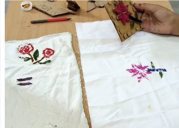
शागिर्दनि पारां मुहर ठायण ऐं हिन्खे छापण जो इस्तेमाल