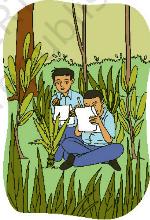
चितार 2.5: जेल आकात्आक् रेकोर्ड