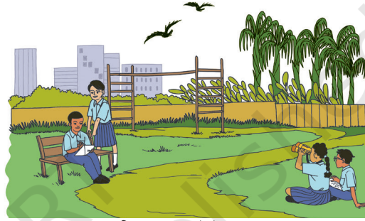
चि॒तार 2.3 (घ)- उद्यान

चि॒तार 2.3 - जिवेत् जियाली रेयाक् जेल बाडाय जायगा- ग॒ड्या, बिर, खेत, उद्यान (चि॒तार रे घाडी सुई रेयाक् दिसारे दाखिन सेच)