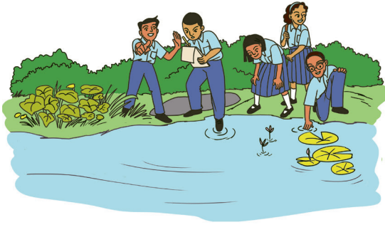
चि॒तार 2.3 (क)- ग॒ड्या