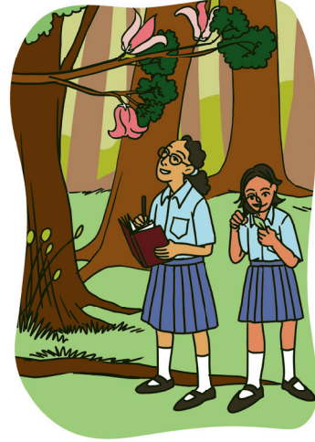
चितार 2.4- मेत् आर आवर्धक लेंसते जेल बाडायमे।