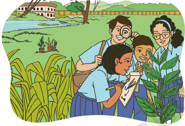
चित्तर 2.2- आबो आडेपासे जिवेत् जियालीको जेल बाडाय आर ओल।

आपनार आडेपासे जेलमे आर ओनको जिवेत् जिनिसको जेल तोलासकोम जाहाँय दो आमेम जेल जाम दाडेयाको काना। आमेम जेला जे सानाम तेजो, बिंदी, तोड़, चेंडें आर एटाक् जियाली कोते परेच् मित्टेन हुडिञ्ज जियाली जेगेत् मेनाक्आ जाहाँय दो दारे-नाँडीगे आकोवाक् जोमाक्को बेनावेत् काना आर नोआ दारे-नाँडी रेयाक् साकाम आर गुदी कोरे ओडाक् बेनावकातेको ताहैनकाना (चित्तर 2.2)। आम नोडकान जाहाँन जेल सामटाव आर ओना खोन जोनोडाव बानाडायको आमाक् जिवेत् जियाली बिबोरोनरे ओलमे।