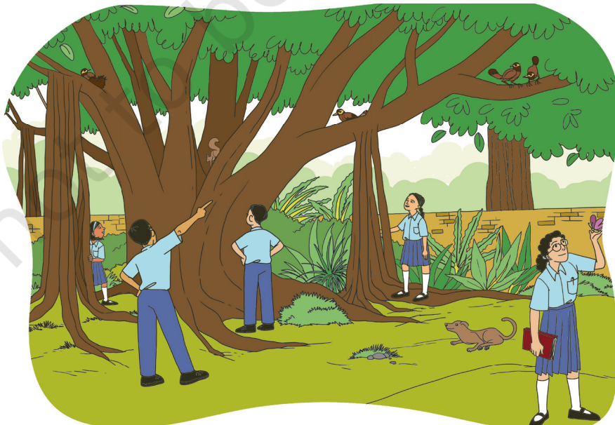
चितार 2.1- आमाक् आडेपासे जिवेत् जिनिस रेयाक् बेगार जेलमे।