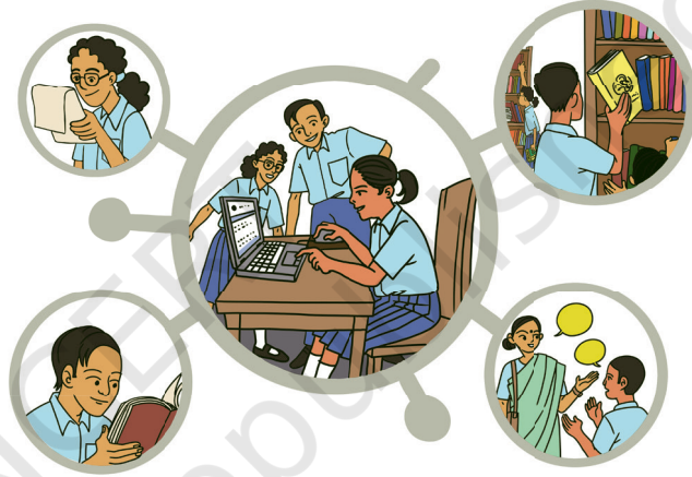
चितार 2.6: आमाक् जारूडाक् बानाडाय जाम लागित् खोबोर रेयाक् आयमा स्रोत बेवहारमे

जुदी आमठेन खोन जाहाँन बाक्डायको छुटाउ आकाना से आमठेन जाहाँन बाड़ती बाक्डाय मेनाक्आ तोबे आम 2.3 खोन 2.7 हाबिच् रेयाक् तालिकारे ओना ओल होयोक् तामा। नोआ बाबोत आम सोमानरे जाहाँय सारघारिया से बाक्डाय होड कोम कुलीदाड़ेयाकोआ आर नोआ साँवते आम "ए. आई." टूल से इस्कूल रेयाक् पुथी ओड़ाक् संसाधोनको बेवहारकाते बाक्डायकोम जाम दाड़ेयाक्आ (चितार 2.6)।