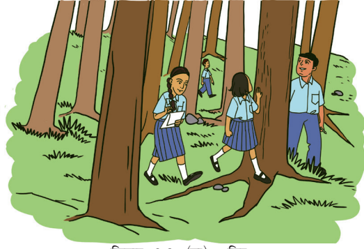
चि॒तार 2.3 (ख)- बिर