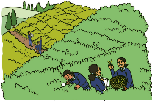
चि॒तार 2.3 (ग)- खेत