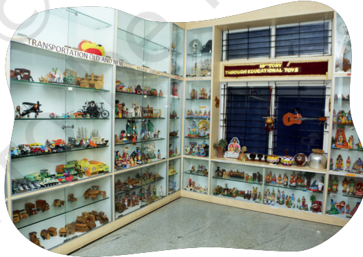
चित्र 5.16- इस्कूल रेयाक् जोगाव दोहो ओड़क्रे सेनेचेत् खेलावना रेयाक् नागामिया मोहोत सोदोर होयाकाना।

हेच् आकान होड़ सोदोरको लाहा आपनार दोलरे हुनार गोड़होन रेयाक् रोड़काते बोरनोन रेयाक् हेवाक्मे।