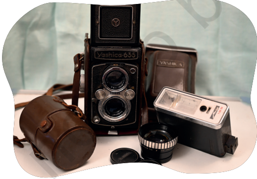
चि॒तार 5.10 - 1960 दशक एतोहोप् रेयाक् कैमरा, फलैश आर लेंस