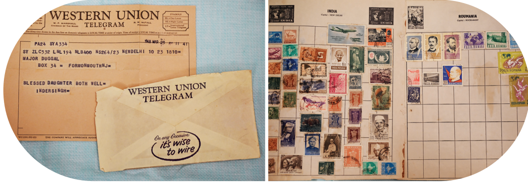
चित्र 5.13 - 1960 दशक रेयाक् टेलीग्राम आर टिकट

जेलेका मितटेन पीतल जिनिस आरूपकाते पॉलिस रेयाक्, काट रेयाक् जिनिस दो लांबित् ब्रशते साफा रेयाक् लाकती होयोक्आ आर किचरीच् दो जाहाँन जालाइ से चोयलो धारे खोन साँगिज सोनतोरते आकाय रेयाक् लाकती होयोक्आ, ओनकागे चितार दो सोनतोरते लिफाफारे नोडका दोहोय रेयाक् लाकती होयोक्आ जेमोन ओना बाड कुचाक् से आलो बाड़िजोक् आर ओना रेयाक् आकार रूखिया ताहेना।