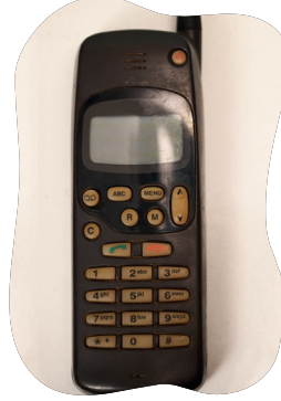
चि॒तार 5.9 - 1998 बोछोर रेयाक् मोबाइल फोन।

सानाम हुनार गोड़होन रेयाक् आपनार मोहोत मेनाक्आ चेदाक् बाड आमाक् हुनार गोड़होन सोनोदोर रेयाक् मुचात् स्टेपरे सेलेत् बाड होयोक्, मेनखान आम ओण्डेनाक् नागाम आर आरीचाली बाबोततेम बाक्डाय।