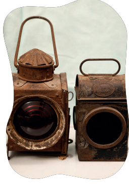
चि॒तार 5.8 - रेलवे रेयाक् मारे लालटेन