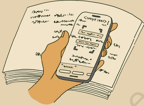
चितार 5.12- तोरजोमा लागित् ए.आई. टूल रेयाक् बेवहार।

गूगल लेंस, माइक्रोसॉफ्ट ऑफिस लेंस, एडोब स्कैन आर टेक्स्ट फेयरी लेकान सानाम एआई टूल ऑप्टिकल कैरेक्टर रिकॉग्निशन (ओसीआर) रेयाक् बेवहार काते चितारते काथा से पाठ (टेक्स्ट) पढ़हाव होय दाड़याक्आ। आम ओना मारे डॉक्यूमेंट 'पाड़हाव' लागित्एम बेवहार दाड़याक्आ जाहाँ पाड़हाव दो मुसकिल गया। नोआ साँवगे डॉक्यूमेंट रेयाक् ओना पारसीते तोरजोमा लागित् हों बेवहार होय दाड़याक्आ, जाहाँदो आमेम बुजहावेत् काना।