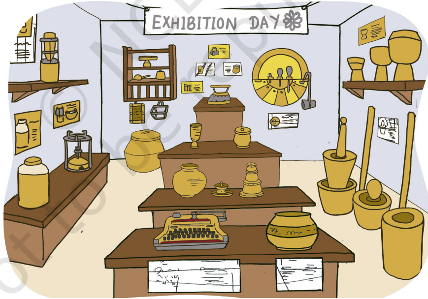
चितार 5.17- जारवावाकात् हुनार गोड़होन रेयाक् सोनोदोर