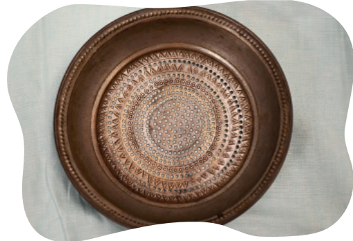
चि॒तार 5.11 - 1940 दशक रेयाक् पीतल चालनी।