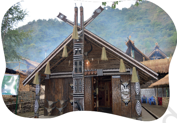
चितार 5.3- किसामा हेरिटेज आतारे खुला होय दोहो जोगाव ओड़ाक् मेनाक्आ, जाहाँर नागालैंड रेन आयमा जनजाती कोवाक् ओड़ाक् सोदोर होय आकाना। ओनारे सानाम ओड़ाक् मित् हाहाड़ावानाक् डिजाइनरे मेनाक्आ।

चेका आपेयाक् ओड़ाक् रे सेदाय खोन हेच् आगुवाकान जिनिसको मेनाक्आ जाहाँ दो जोगाव दोहोय ओड़ाक् रे सोदोर होय दाड़ेयाक्आ? ओनाको आपनार आडेपासे सेंदरायमे आर केलासरे आगुयमे। जुदी आम ओनाको हुनार गोड़होन केलासरे बाम आगु दाड़ेयाक्आ, तोबे ओना रेयाक् चितार से फोटो हातावमे आर ओना आपनार इस्कूल रेयाक् जोगाव दोहोय ओड़ाक् रेयाक् हिसा बेनावमे।