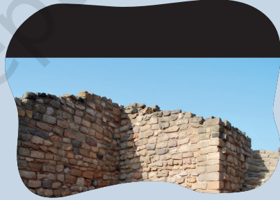
चितार 5.4- किला रेयाक् पुरुब दुवारे पाहरादार कांदाहा, धौलावीरा।

आमदो सोमाज साडेसरे सिंधु-सरस्वती सोसनोत् बाबोत् रेम पाडहाव आकात् गया। आम दो धौलावीरा (चितार 5.4) बाबोत् रेम पाडहावात् गया। भारोत् रेयाक् मानचितार रे धौलावीरा रेयाक् चितारको संदरायमे। पुरातात्विक जायगा दो ओनकान जायगा काना, जाहाँ दो मारे मानवा जीबोन रेयाक् सारेचको जोगाव मेनाक्आ। नोआ जायगा रेयाक् ला दो पुरातत्वविद होतेते होयोक्आ। ओनको नोआ जायगा नापाय लेकातेको लाया आर जाहाँ हुनारचितार आर एटाक् सारेचको सामाडरे हिजुक्आ, ओना रेयाक् को पुसटावा। नोआ हुनार चितार आबो नोआ बुजहावरे गोडोय एमाबोना जे नोआ जायगारे आयमा बोछोर लाहा चेत लेकान सोसनोक् चाबाक् डाहारे ताहेकाना। ला सोमोय जाम आकान जिनिस दो ओना सोररे मेनाक् जोगाव दोहोय ओडाकरे दोहो होयोक्आ।