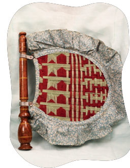
चित्र 5.15- दोहड़ाआचुर ऊन आर किचरीच् रेयाक् तीते बनावकान मारे पंखा जाहाँ रेयाक् बेवहार सानाम ओड़ाकरे आउरी बिजली हिजुकरे होयोक् कान ताहेना।