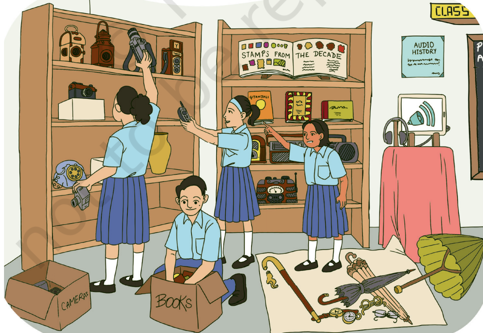
चितार 5.1- इस्कूलरे जोगाव दोहोय ओडाक् रेयाक् थापना।