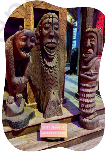
चितार 5.2- मध्य प्रदेश रेयाक् भोपालरे मेनाक् जनजातीय जोगाव दोहोय ओड़ाक्रे आयमा जनजाती कोवाक् आरीचाली हुनार, शिल्प आर आरीचाली सोदोर मेनाक्आ।