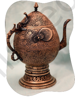
चित्र 5.14- कश्मीर रेयाक् पीतल समोवर (चाय बनाव रेयाक् भाजान)

1. हुनार गोड़होन रूखियावानाक् आर नापाय ओबोस्तारे ताहेन नोआ गोठाय लागित् आमदो चेत्एम चेकाया?