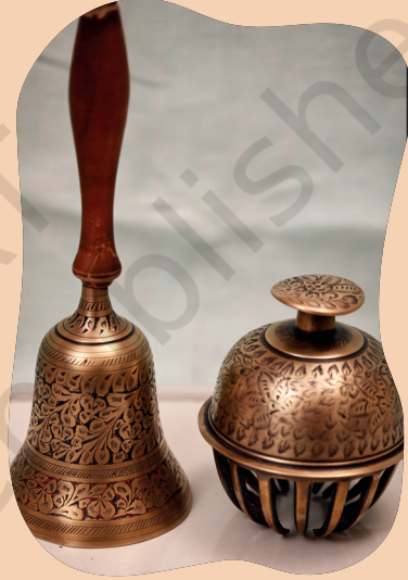
चितार 5.6- पीतल रेयाक् मारे घंटी

आम जोगाव दोहो ओइाकरे सोनोदोर आकान जाहाँ हुनार गोइहोनकोम बाछाव दाइयाक्आ। ओना रेयाक् नागाम आर उदगाउको उदुक् तुलुच् मित् ओकते हाटिज बेनावमे। जाहाँरे नोआ सेलेत् ताहें जे नोआ रेयाक् मोटामुटी तिस बेवहार होयोक्कान ताहेंना आर जुदी नितहों नोआ रेयाक् बेवहार होयोक् काना, तोबे चेतलेका होयोक् काना। आम नोआ खोन जोनोइाव जाहाँ मोहोतानाक् घोटीना रेयाक् बिबोरोन हों तेयार दाइयाक्आ, जेलेका जाहाँय पेड़ा होइ होतेते नोआ हाडामबा आर बुडीगोवाक् बापलारे एम होयलेना आर नोआदो आतारे उन जोखेन रेयाक् पंहिल जिनिस ताहेंकाना (जेलेका- मित् मारे रेडियो से कैमरा)।