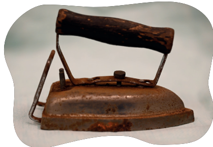
चितार 5.7 - 1950 दशक रेयाक् मारे चल इस्त्री (ट्रैवलिंग आयरोन) जाहाँ दो बिजलीते चालाक्कान ताहेंना।

आम आपनार सानाम गातेको साँव मिलाउ काते मोंडें गोटेन हुनार गोइहोन बाछावमे जाहाँ दो जोगाव दोहो ओइाकरे सोनोदोर रेयाक् हिसा होयोक्आ। आमदो नोआ आडी सोनतोरते बाछाव होयोक् तामा आर नोआ हों लाइ होयोक् तामा जे आमदो नोआ हुनार गोइहोन चेदाक्एम बाछाव केदा आर एटाक् आक् दो चेदाक् बाम बाछाव लेदा।